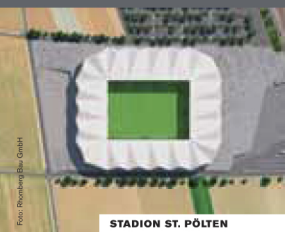
STADION ST. PÖLTEN

ab 17:30 Sommerfest – mit Unterstützung des BMW