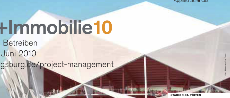
STADION ST. PÖLTEN