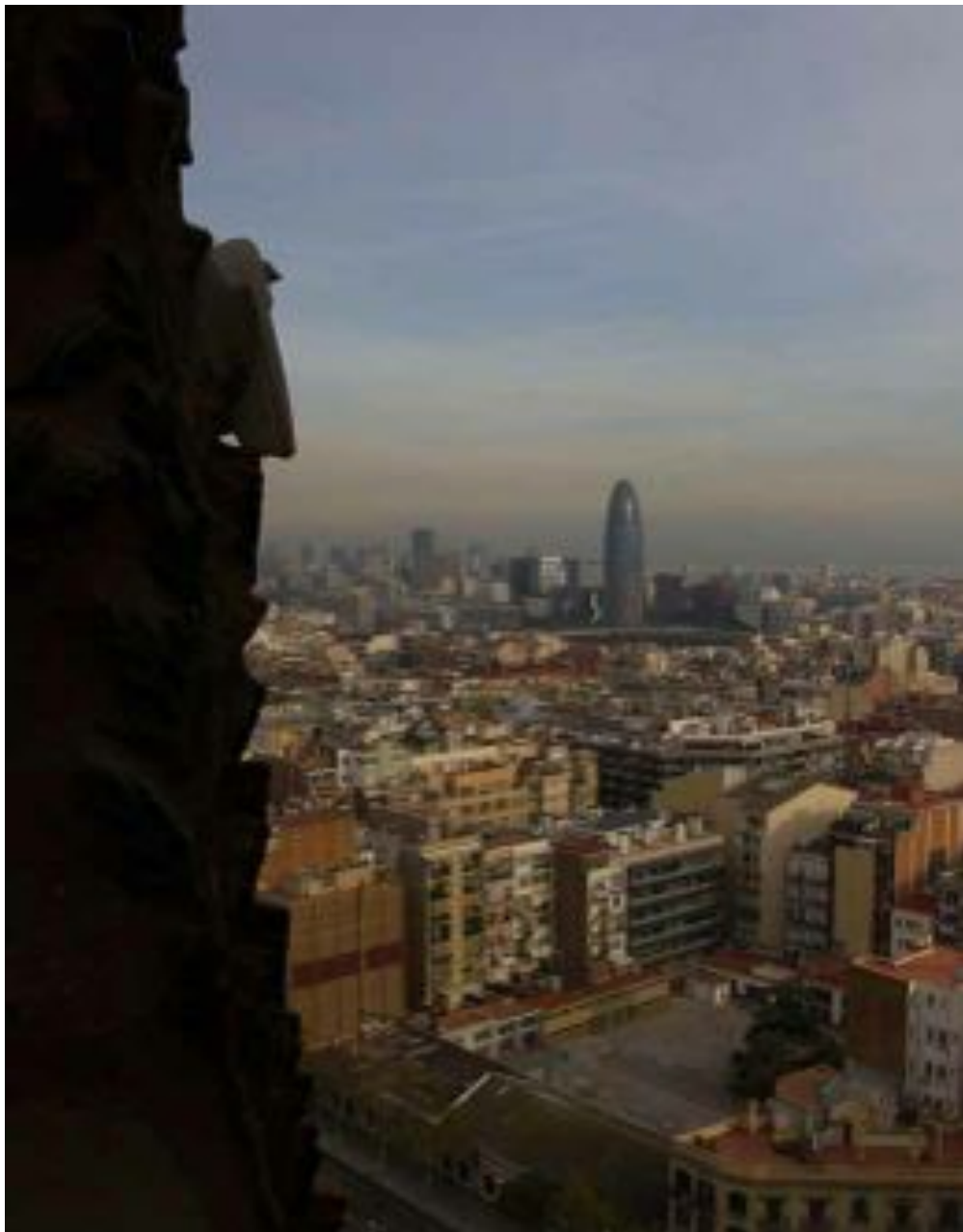
AUSBLICK VON DER SAGRADA FAMILIA