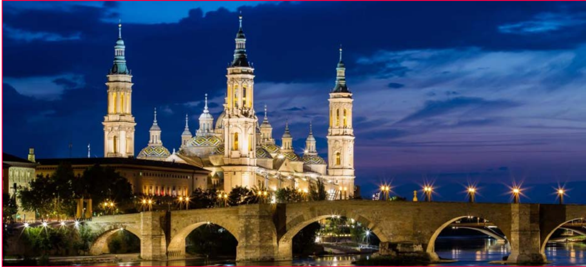
Basilica del Pilar