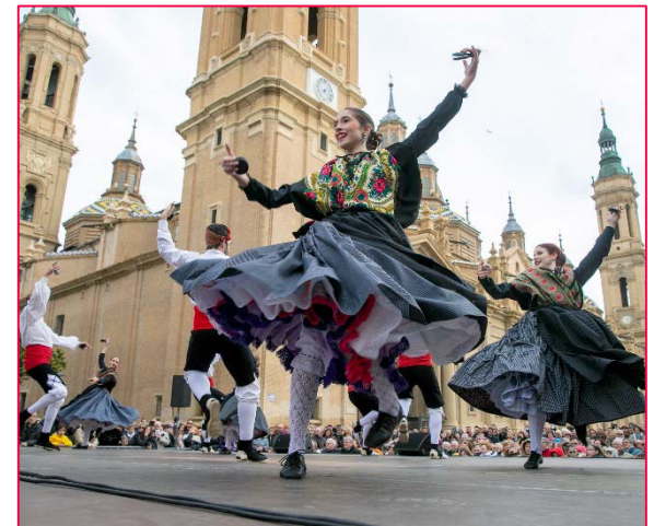
Fiestas del Pilar