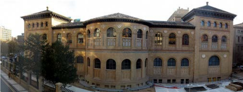
Das Naturkundemuseum, welches sich direkt an den Campus Gran Vía anschließt.

Die Fakultät für Wirtschaft ist nicht Teil des Unicampus im Univiertel, sondern auf der Gran Vía im Zentrum beim Plaza Aragón.