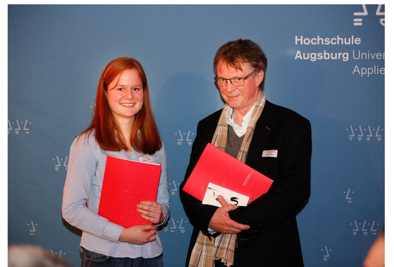
Tandem der Fakultät für Architektur und Bauwesen

Zur tiefgreifenden Vernetzung aller Teilnehmerinnen und Teilnehmer werden Begleitseminare mit den Schwerpunkten Karriereperspektive und Work-Life-Balance angeboten. Darüber hinaus tauschen sich die Tandems in lockerem Rahmen aus, wie beispielsweise beim Landkreislauftour oder bei einer Bergtour. Dabei kommt nicht nur ein interdisziplinärer, fakultätsübergreifender Austausch in Gang, sondern es lernen sich auch inspirierende Persönlichkeiten gegenseitig kennen.