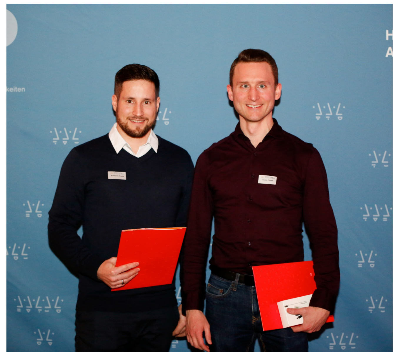
Tandem der Fakultät für Gestaltung