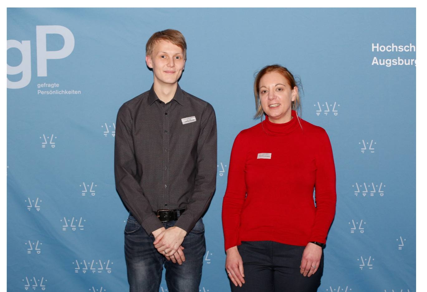
Tandem der Fakultät für Elektrotechnik