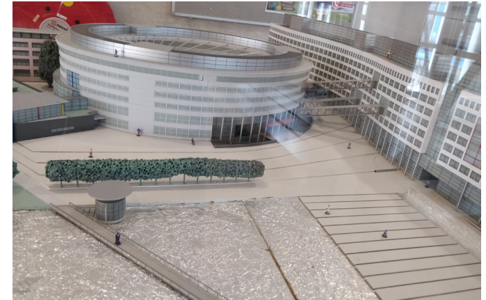
Model der Hochschule in Den Haag

Als Internationaler hat man in Den Haag keine Probleme. Wie schon erwähnt gibt es von mehreren Fakultäten Willkommensfeiern und auch extra Angebote für Internationale Studenten. Generell wird aber fast jeder Studiengang auch in Englisch angeboten, was dazu führt, dass jeder an der Hochschule guten Englisch spricht. Da die Stadt von der internationalen Politik geprägt ist, ist Englisch die zweite Amtssprache. Es gab in meinen