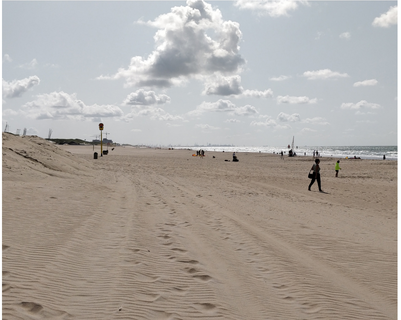
Blick auf Rotterdamer Hafen vom Strand in Den Haag