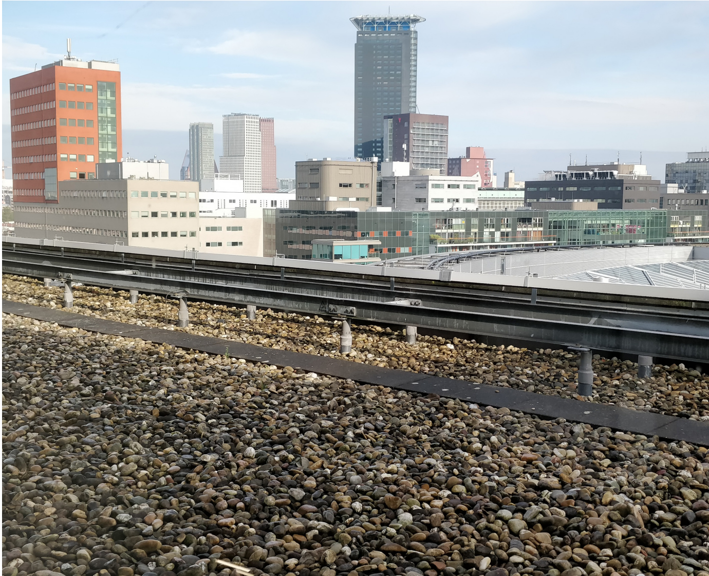
Aussicht aus dem 8. Stock der Hochschule