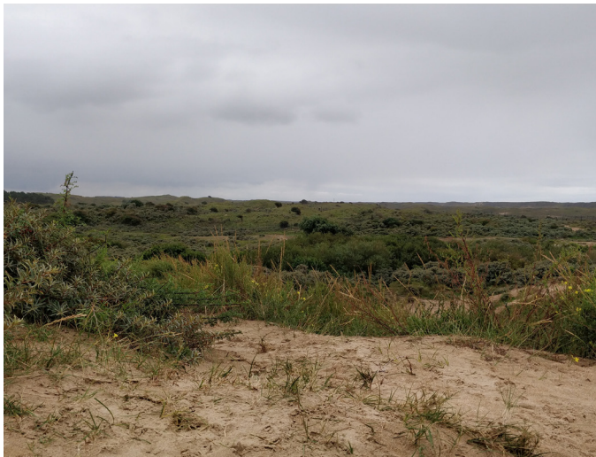
Dünen in Sandvoort