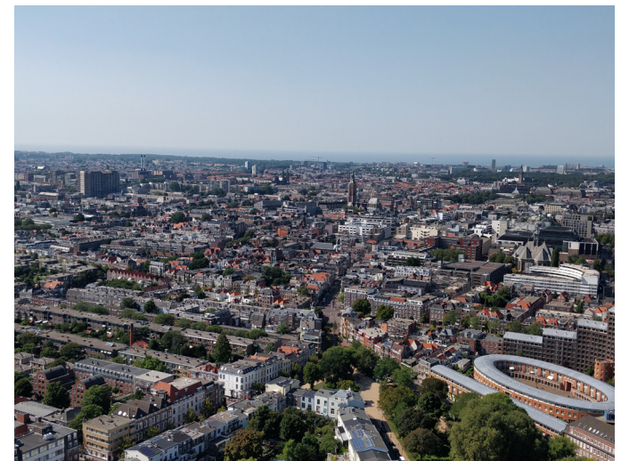
Blick vom Höchsten Gebäude in Den Haag (links zu sehen)