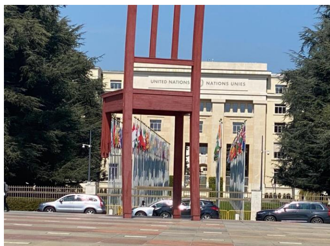
Vereinten Nationen in Genf