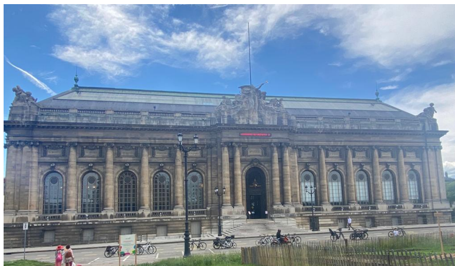
Musée d'art et d'histoire