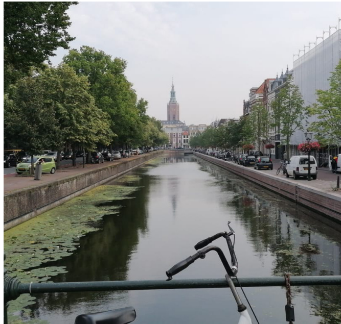
Abends in Den Haag

Den Haag ist teuer - von den Wohnungskosten zu Restaurants zu den Supermärkten. Bei der Wohnungssuche kann man Hilfe von der THUAS erhalten, welche mit verschiedenen Studentenwohnungsprovidern zusammenarbeitet. Um diese Hilfe zu