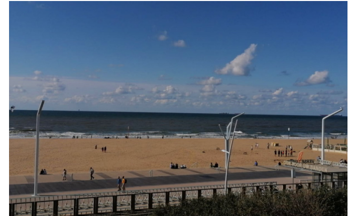
Strand bei Scheveningen

Es ist ziemlich einfach, als international Student in Den Haag zurechtzukommen. Zu Semesterbeginn gibt es einige Veranstaltungen, bei denen einem geholfen wird, sich in der Uni (und der Stadt) zurechtzufinden. Die Sprache ist auch keine wirkliche Barriere, da man mit Englisch immer weiter kommt. Viele Kurse