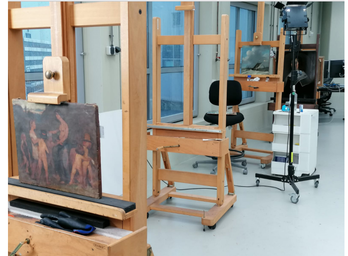
Exkursion zu einem Museumslager