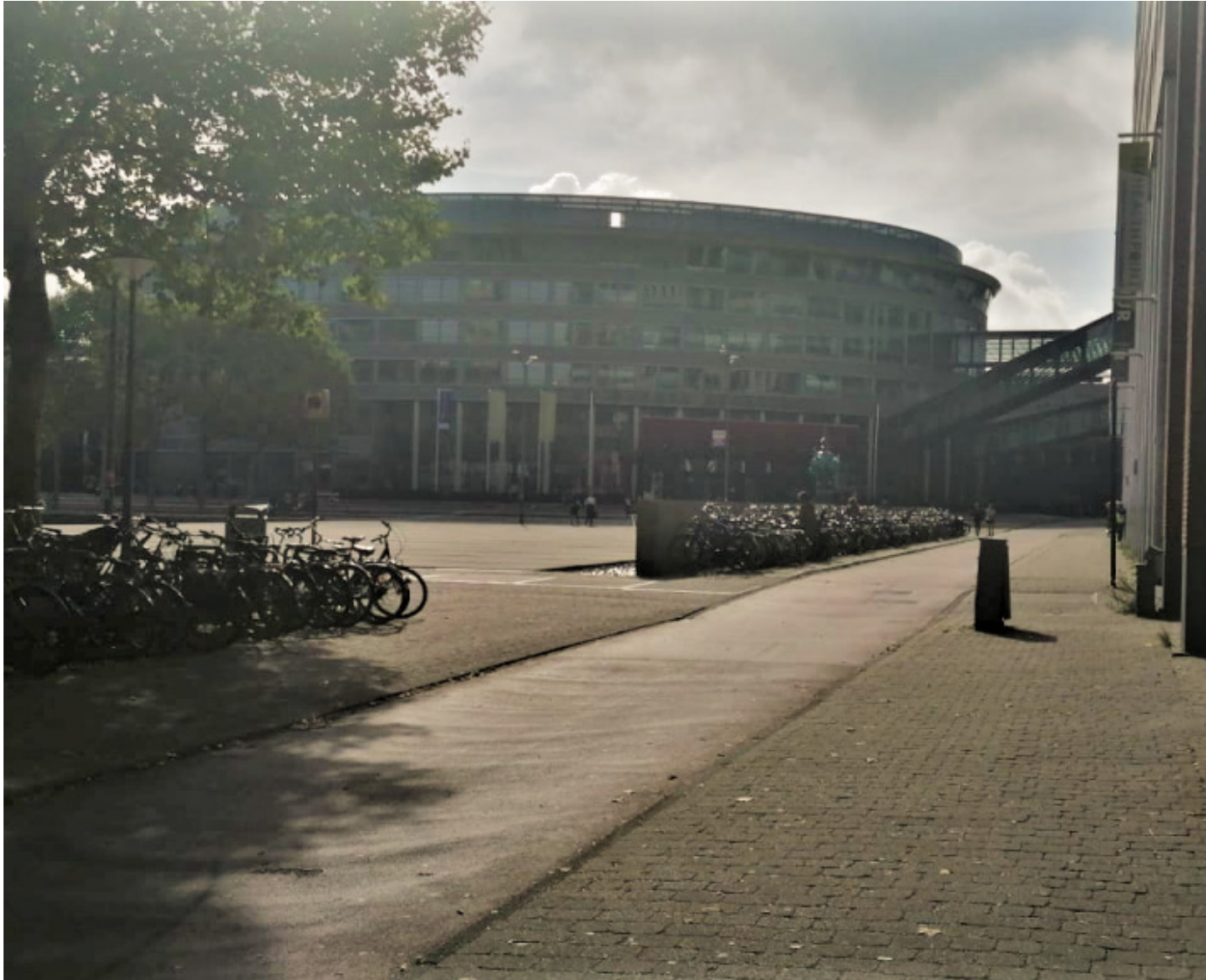
Ruhiger Tag am Campus