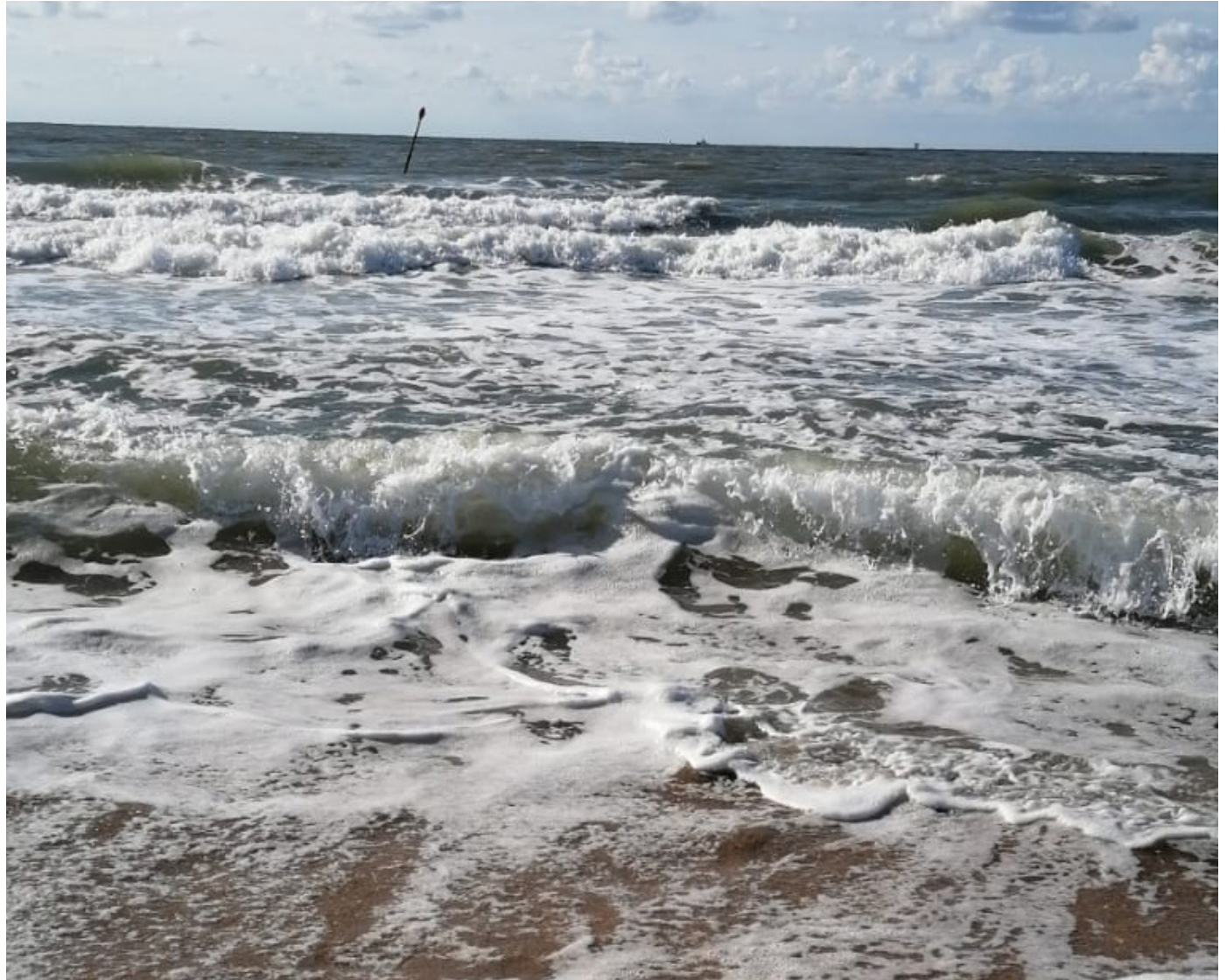
Strand mit Wellengang