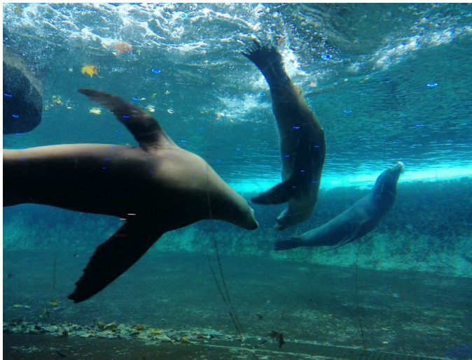
Zoo in Amsterdam