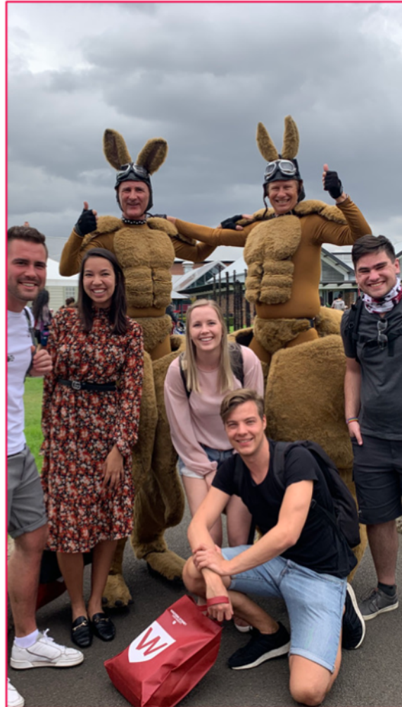
21.02.2020 Einführungswoche South Campus

Das Semester dauerte 3 Monate und ging von Mitte Februar bis Ende Juni.