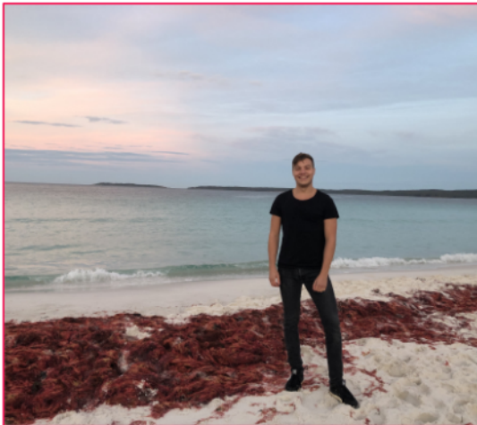
31.05.2020 Hyams Beach

Wenn ihr in Sydney seid nutzt die Zeit auf jeden Fall zum reisen. Es gibt so viele schöne Orte die man perfekt mit einem Tagestrip erkunden kann. Ihr werdet sowieso schnell Freunde kennenlernen die ebenfalls Lust haben Sydney und die Umgebung zu erkunden. Macht euch da am besten einen Plan wo ihr überall hinwollt und plant dann euer Tagestrip.