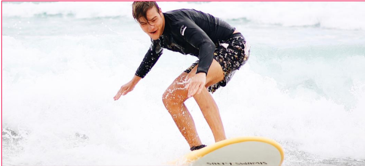
27.02.2020 Bondi Beach