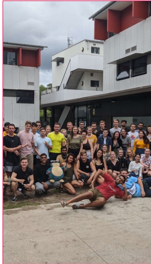
23.02.2020 Parramatta Village

Die Unterkunft ist ein bisschen überteuert für das, was man bekommt, und ich hatte wegen Corona keine guten Erfahrungen mit dem Management des Village.