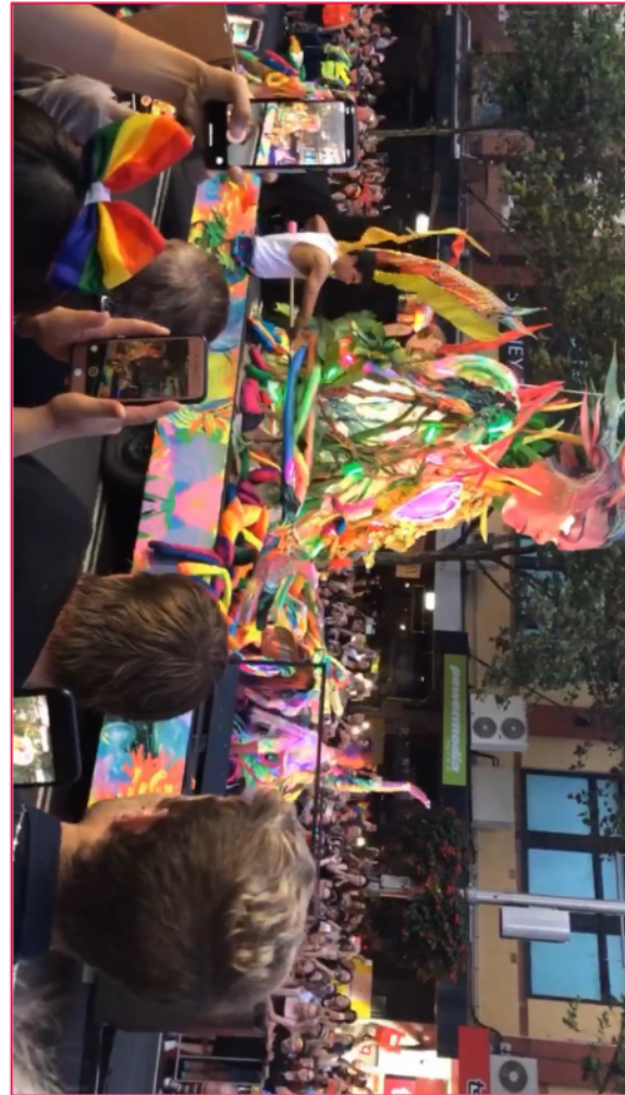
29.02.2020 Mardi Gras

Leider wurde wegen Corona vieles abgesagt, so dass ich nur wenig von der Kultur und Tradition erleben konnte.