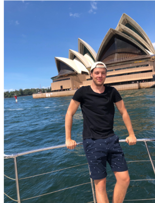
29.02.2020 Sydney Opera House

Die Anreise ist ziemlich entspannt, ihr könnt über die WSU ein Shuttle Service buchen, welches für euch kostenlos ist. Ihr werdet dann am Flughafen abgeholt und direkt zum Village gefahren.