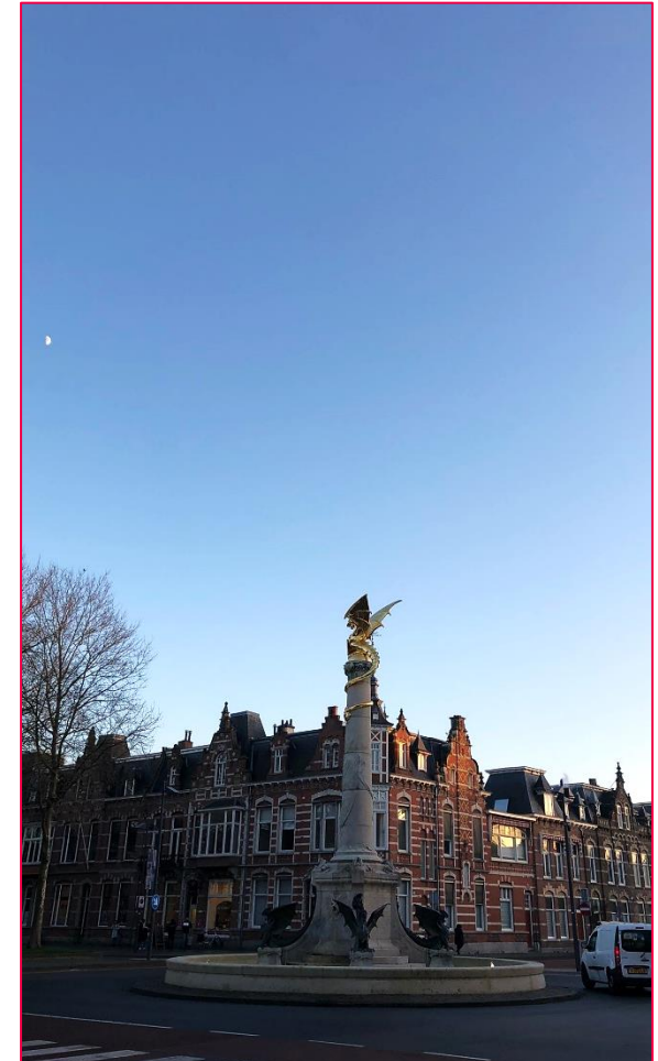
Drakenfontein, Den Bosch (am Bahnhof)

Um die Karte beantragen zu können benötigt man ein niederländisches Bankkonto. Da würde ich „Revolut“ empfehlen.