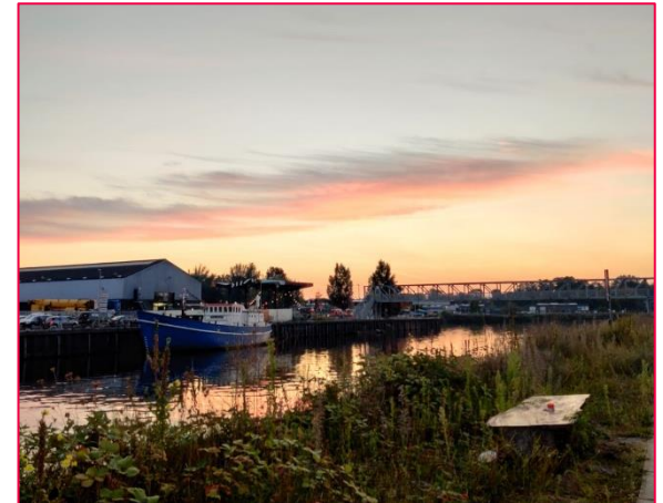
Rotterdam, Noordwijk Strand, Brüssel, Breda