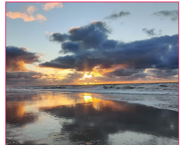
Kinderdijk, Zaandam, Nordwijk Strand