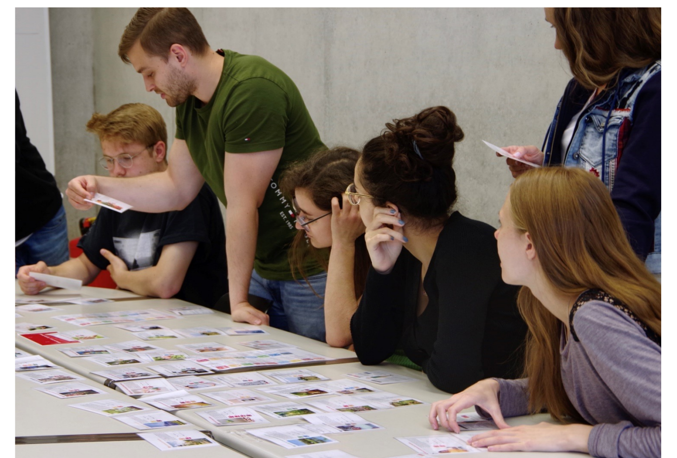
Zum Start eine Überblick über das Maßnahmenpaket verschaffen