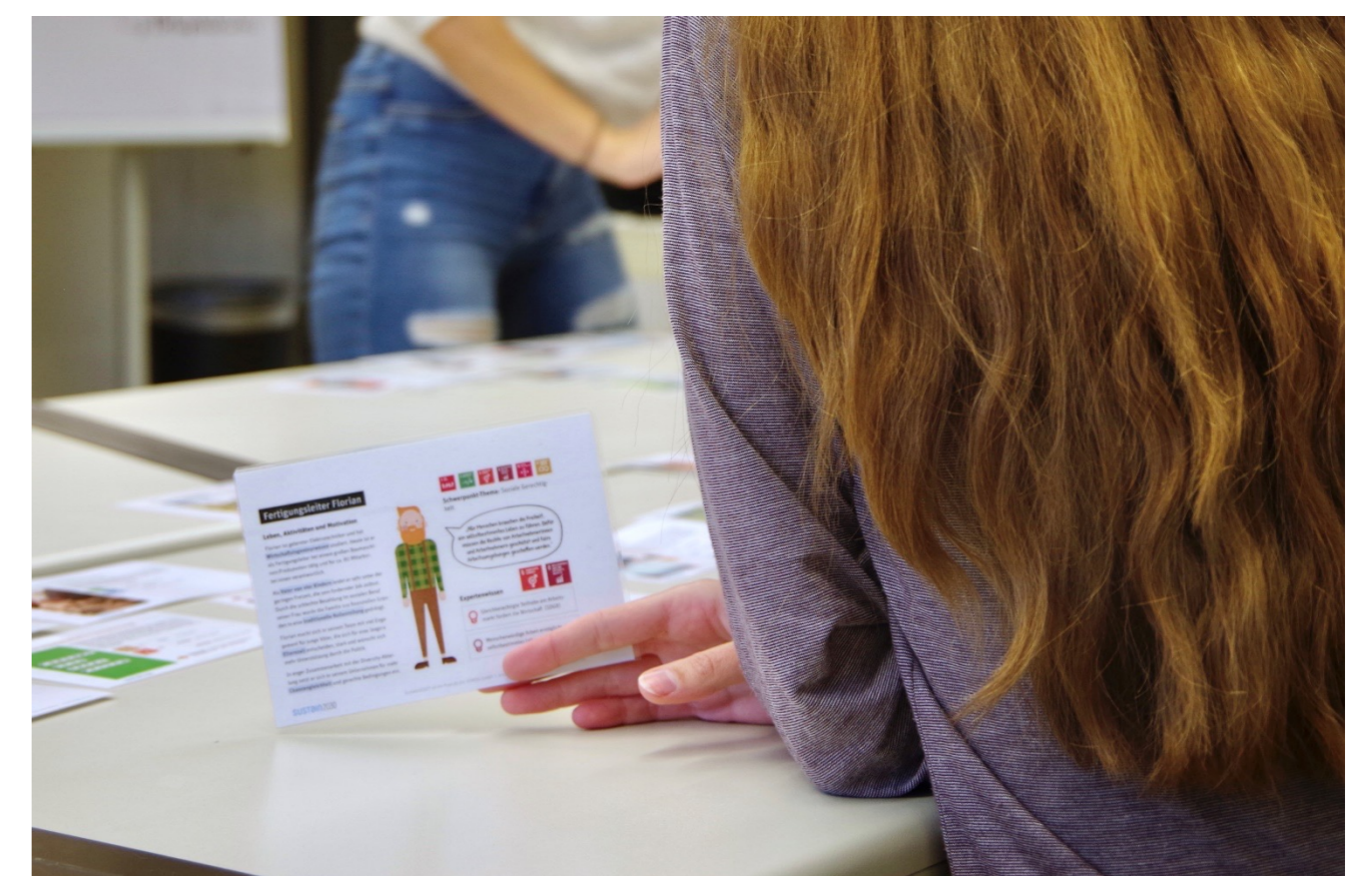
Die Teilnehmenden definieren ihre Position in den Debatten

Das Planspiel „Sustain2030“ zielt darauf ab, das Bewusstsein für Nachhaltigkeit in ökologischer, sozialer und ökonomischer Dimension zu fördern. Es geht um die Frage, was wir heute tun können, um für ein lebenswertes Morgen zu sorgen. Das Planspiel fördert die Kompetenz, Lösungen im Miteinander zu finden und ermöglicht somit einen Perspektivenwechsel untereinander. Die Wichtigkeit besteht darin, alle SDGs gleichwertig zu behandeln, denn kein Ziel darf auf Kosten eines anderen erreicht werden. Die Teilnehmenden erlangen dadurch ein Verständnis über die Komplexität der Wechselbeziehungen und Abhängigkeiten zwischen den SDGs. Ebenso gilt es als Lernziel, sich der Parallelen zwischen Planspiel und Realität bewusst zu werden, um somit zu erkennen, welche Themen besonderer Aufmerksamkeit bedürfen, welche Ereignisse wie verhindert werden können und wo noch Handlungsbedarf in Gesellschaft, Politik und in Unternehmen besteht.