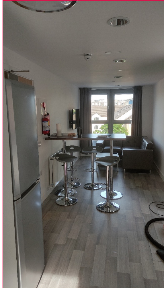
Studentenwohnung in Orwell Terrace

Es gibt verschiedene lange Mietverträge, die sich nach den Trimestern richten. Da ich zwei Trimester dort studiert habe war mein Mietvertrag 39 Wochen lang. Insgesamt habe ich dafür um die 6.600 GBP gezahlt. Es gibt auch die Möglichkeit für 50 Wochen ein Zimmer zu mieten. Wenn man dort studiert, ist ein Platz im Wohnheim sicher, solange man sich rechtzeitig bewirbt.