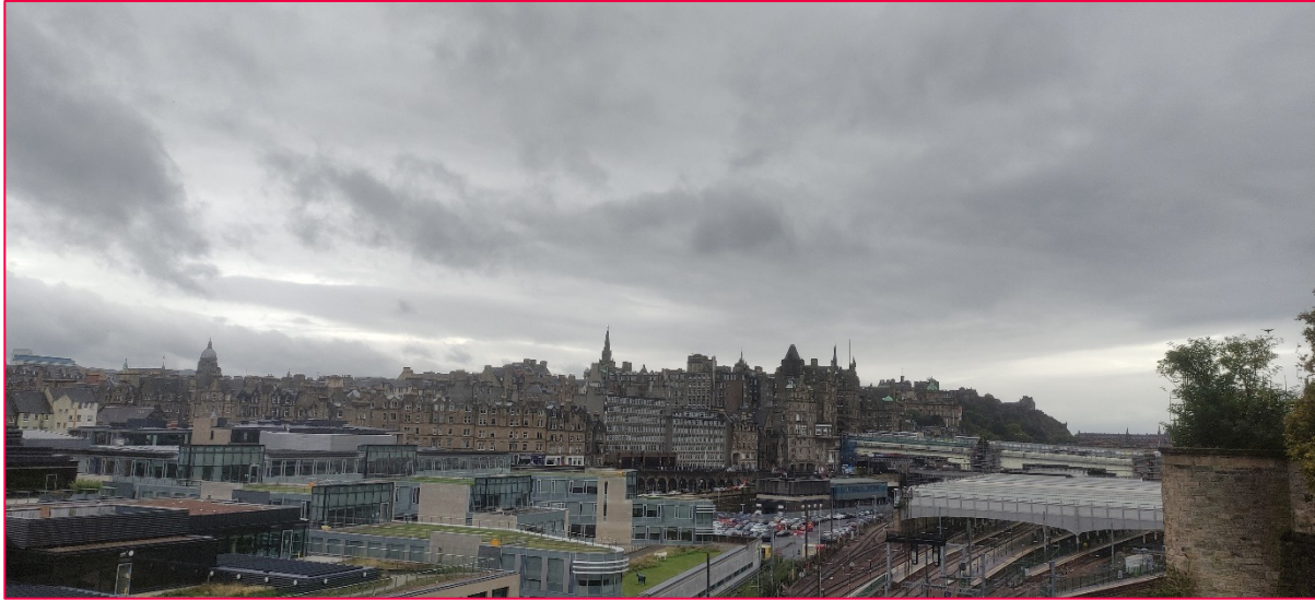
Aussicht beim Burns Monument