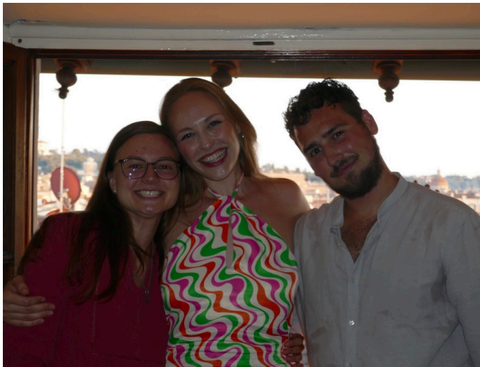
Bildunterschrift: Ich und meine Mitbewohnerinnen