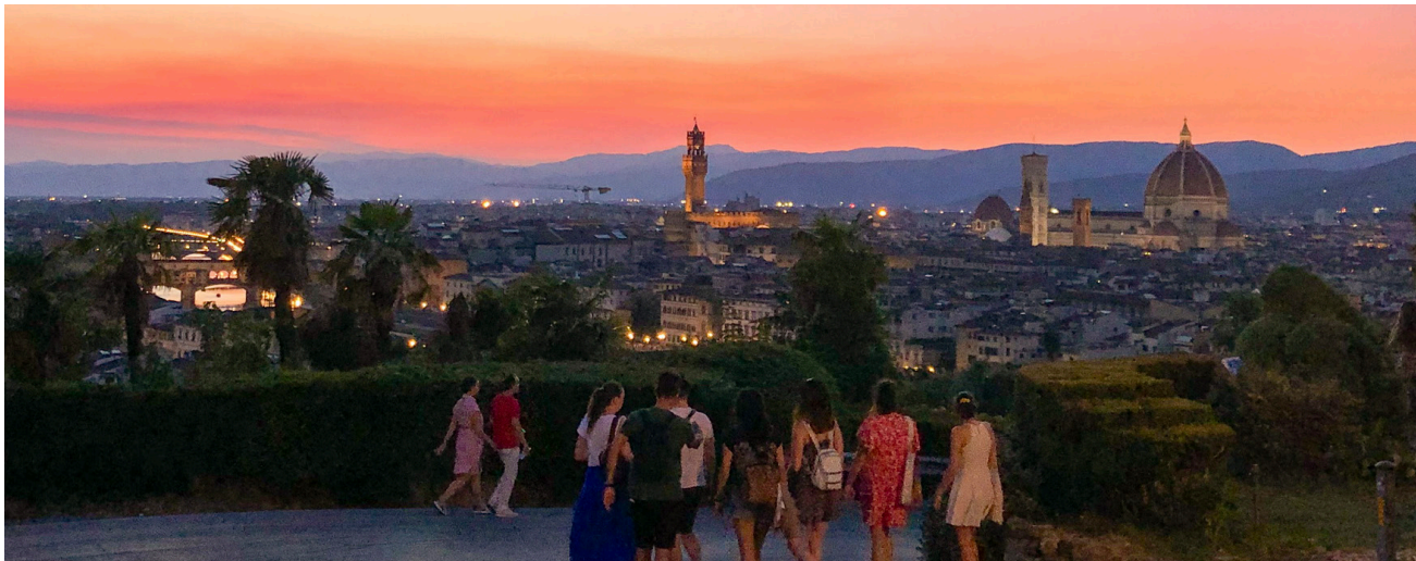
Ausblick vom Piazzale Michelangelo