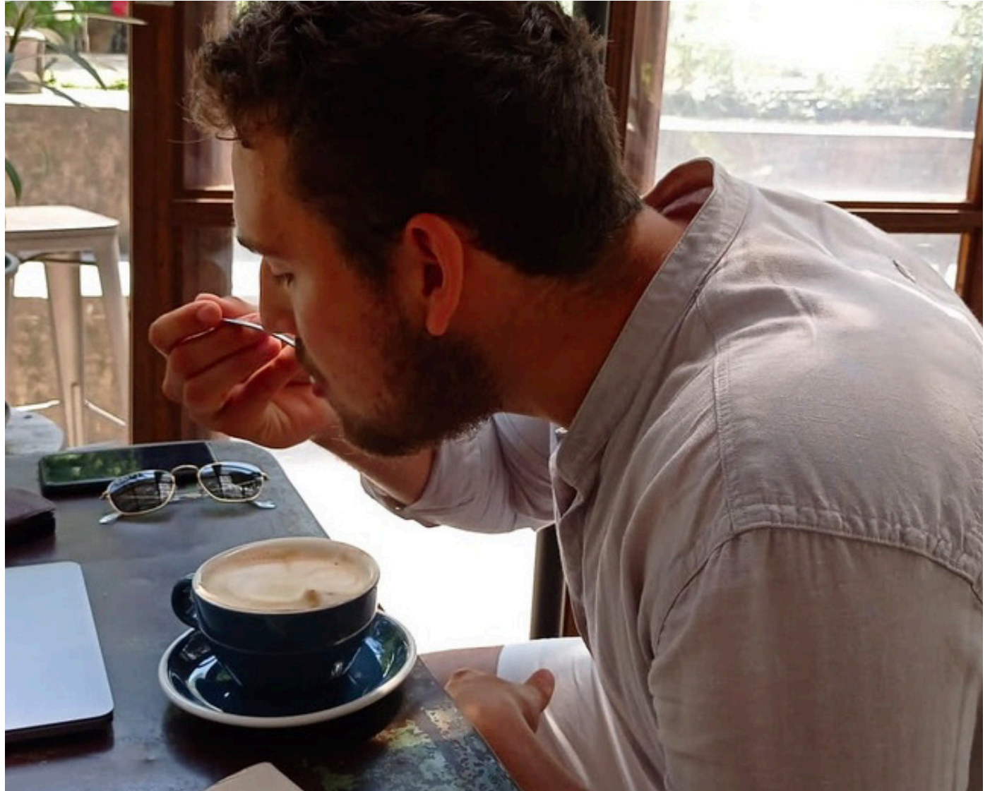
Bildunterschrift: "Studieren" im study café