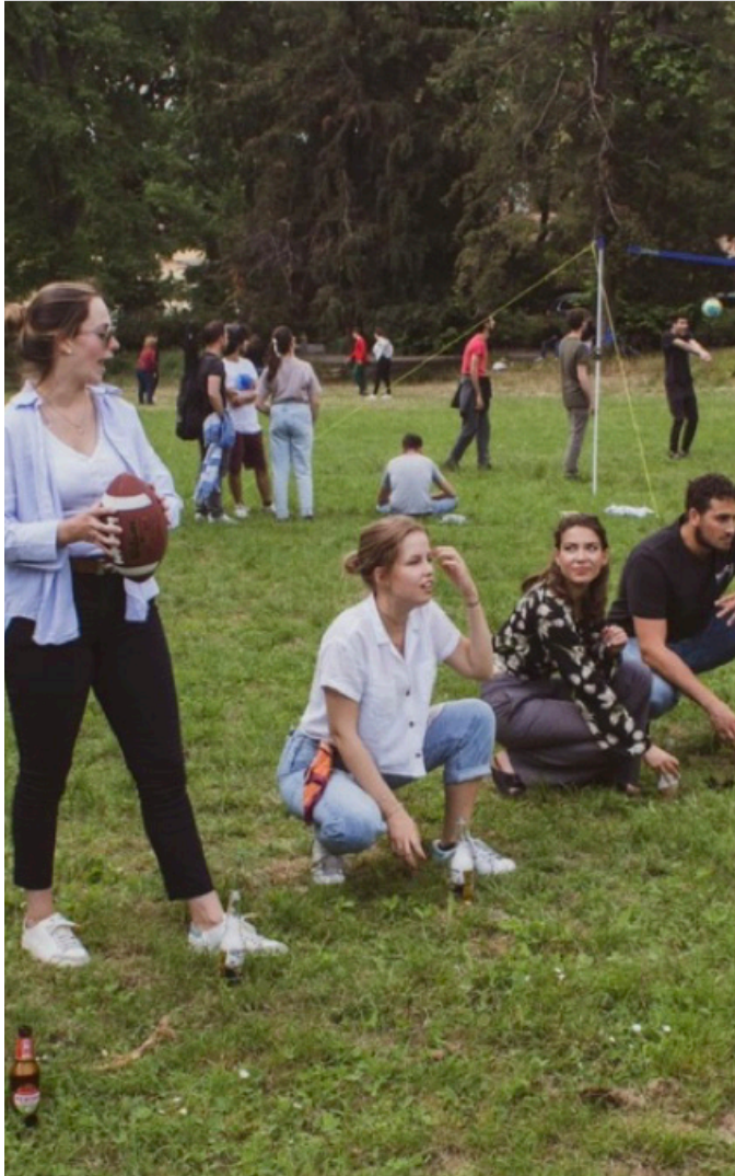
Flunkyball im Park Cascine