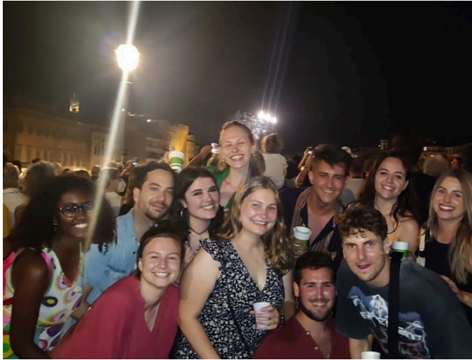
Bildunterschrift: Party mit ERASMUS student:innen