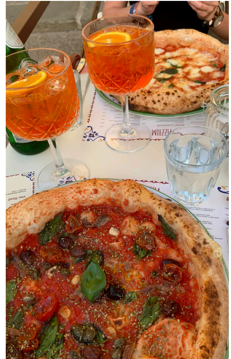
cena im centro storico