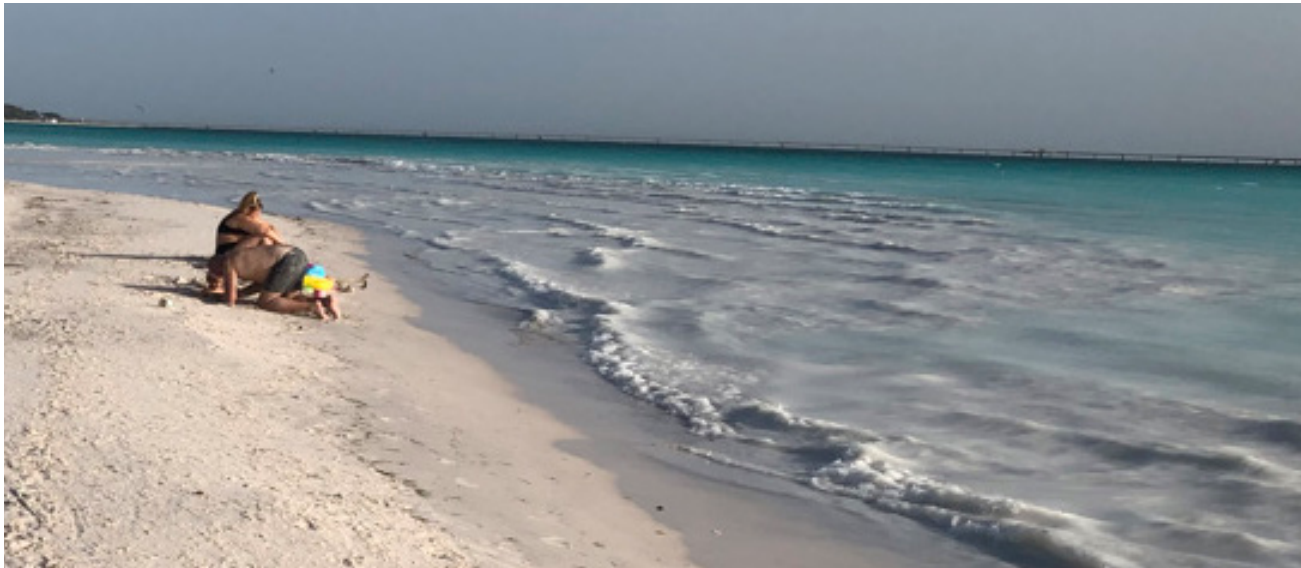
Westküste der Toskana