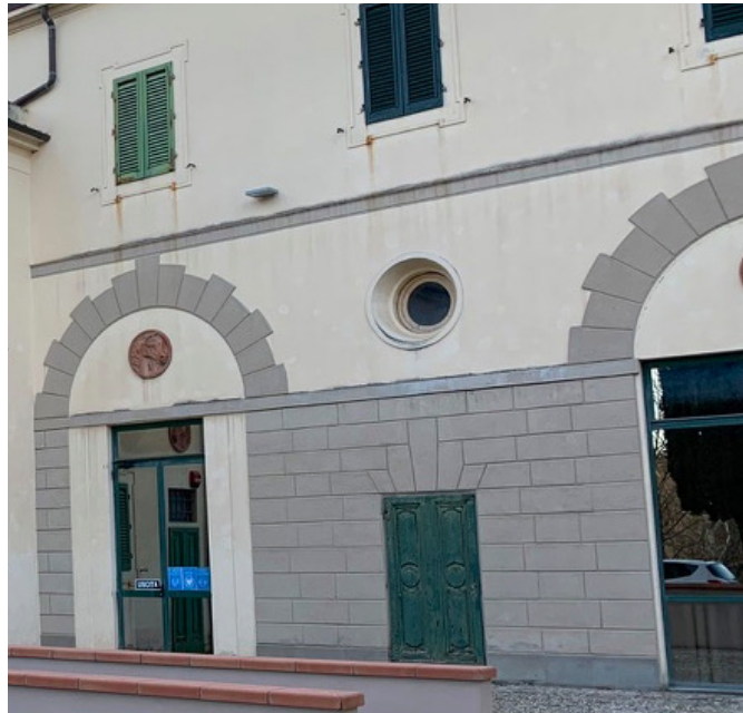
Kampus ISIA Firenze

Vergleicht man die Preise für Lebensmittel und Haushaltsgegenstände in Supermärkten, sind diese nicht mit den deutschen Standards zu vergleichen. Im vergleichsweise günstigen Super-