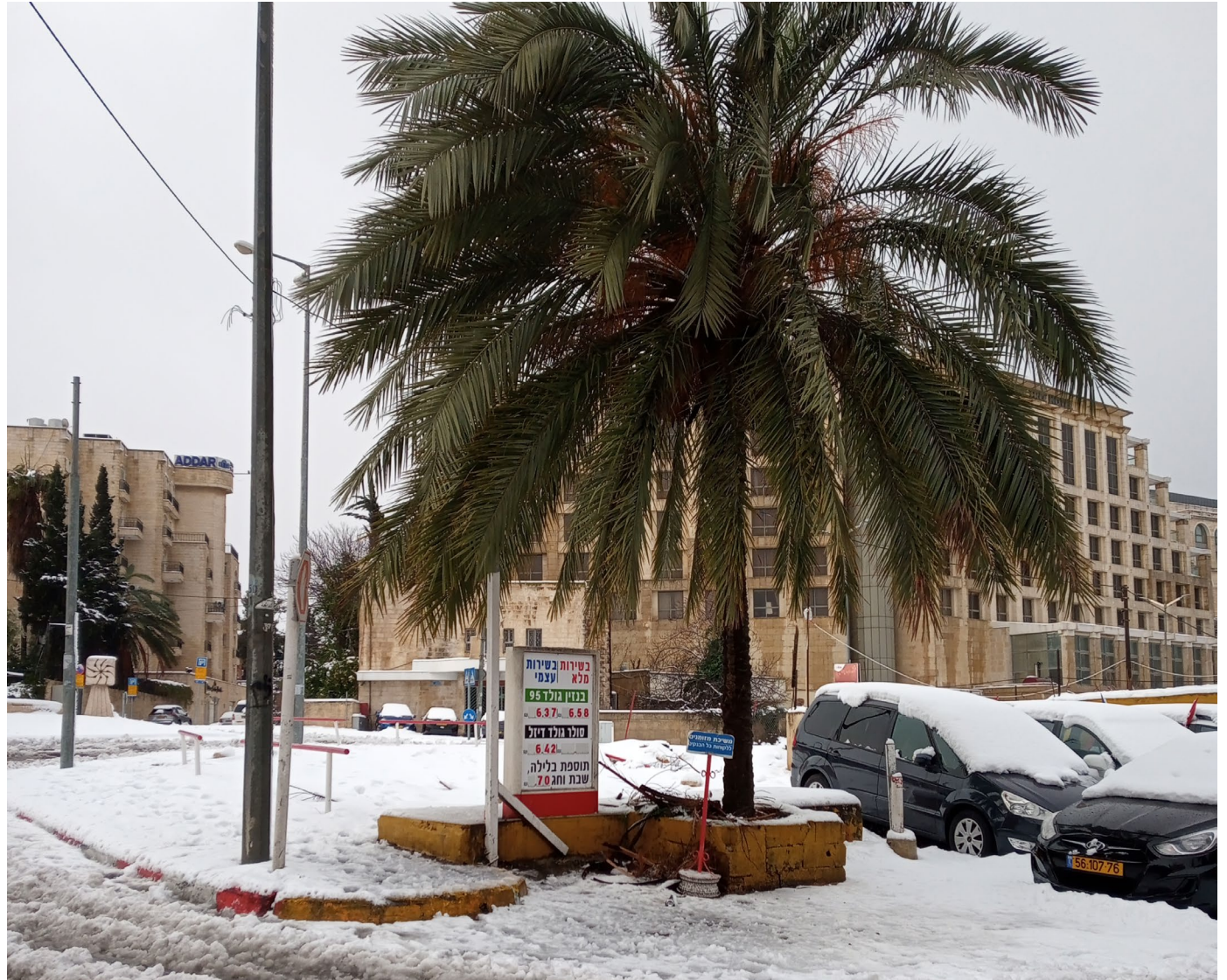
Bildunterschrift: Neujahrsschnee in Jerusalem