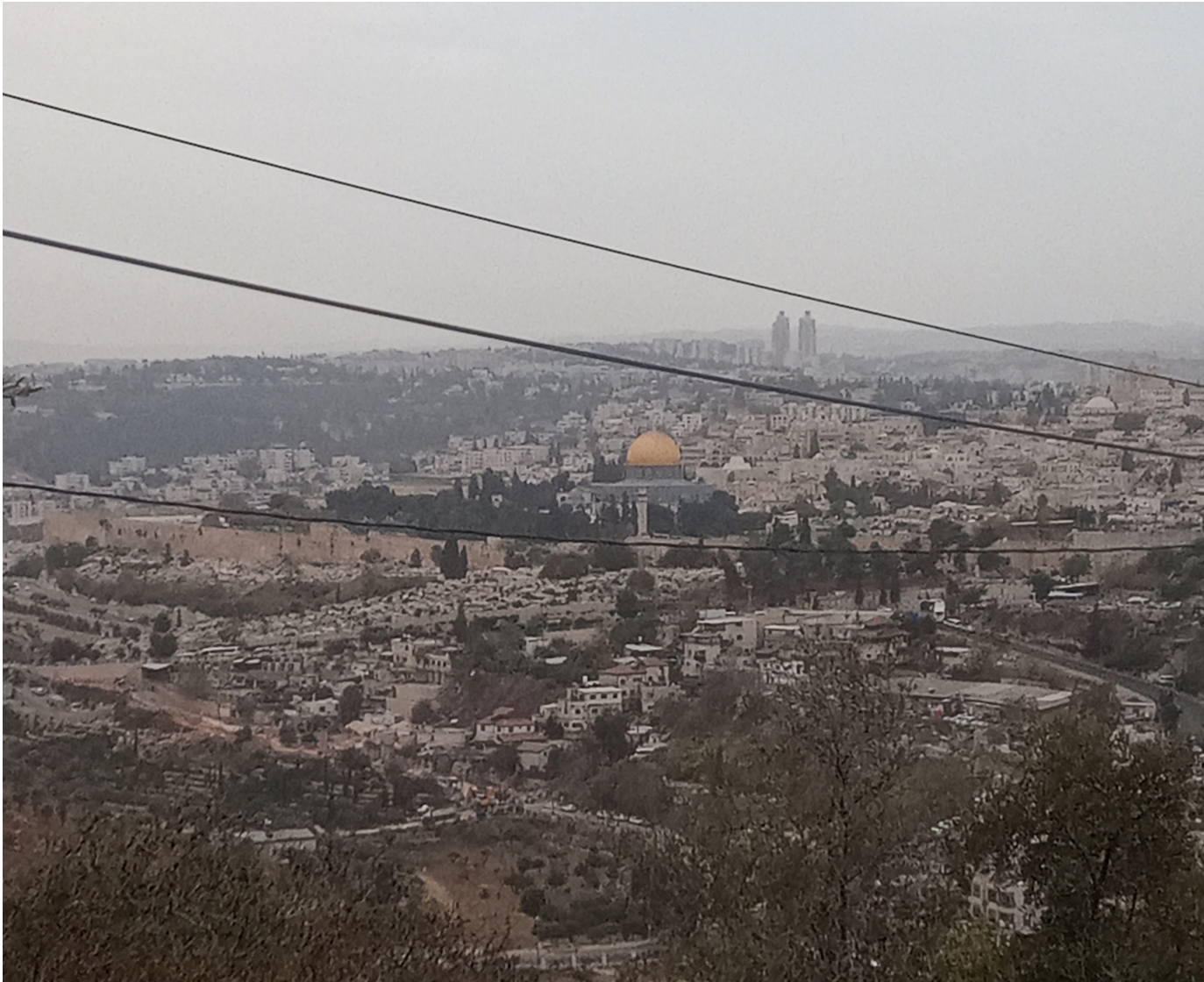
Bildunterschrift: vom Campus blickt man direkt auf die Altstadt