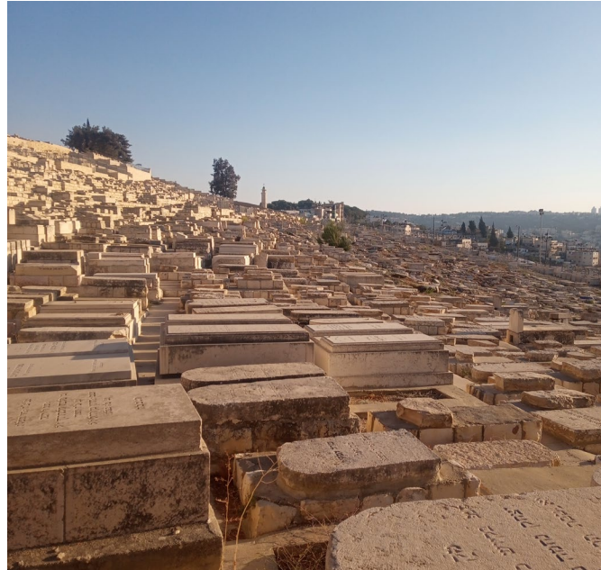
Bildunterschrift: Friedhof am Rande des Mount of Olives

Öffentliche Verkehrsmittel sind in Israel recht preiswert. Das Zugsystem zeichnet sich besonders durch seine Pünktlichkeit aus während Busse häufig im Jerusalemer Stau stecken.