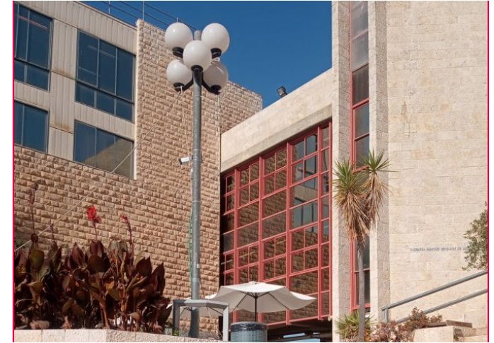
Bildunterschrift: Treppe zum Haupteingang