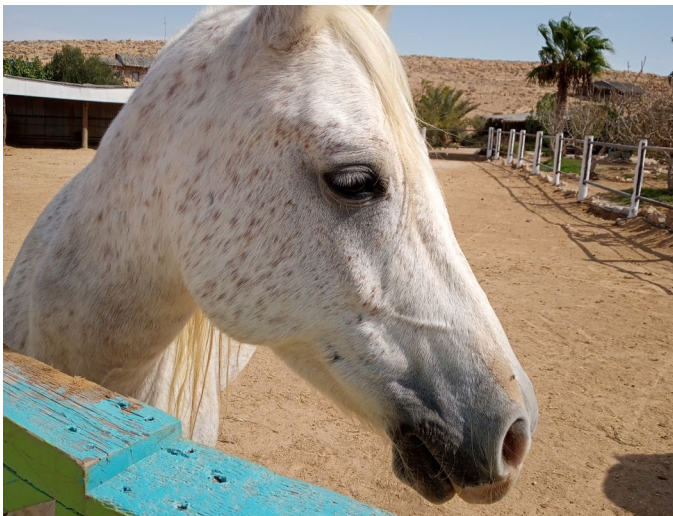
Bildunterschrift: Volunteering in der Wüste Negev