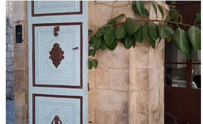
Bildunterschrift: Via Dolorosa

Zur Ankunft an der Uni erhält man eine Liste von den Kursen, die offen für Austauschstudierende sind. Leider sind nicht alle Kurse, die auf der Website aufgeführt sind, für Studierende ohne Hebräisch Kenntnisse zugänglich.