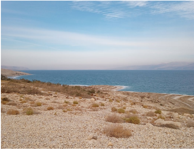
Bildunterschrift: Spaziergang am toten Meer