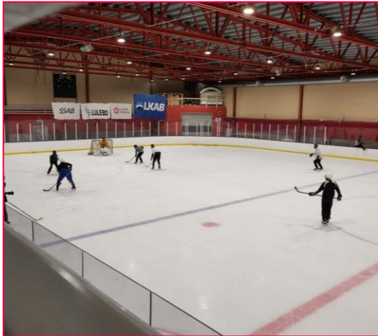
Icehockey in der Cooparena

Zusätzlich kann ich jedem Austauschstudenten empfehlen, dem Icehockey Team für Auslandsstudenten beizutreten. Gegen eine kleine Gebühr werden Trainer, Ausrüstung und Trainingsplatz zur Verfügung gestellt. Das Training fand drei mal in der Woche statt und war ein super sportlicher Ausgleich zum Alltag. Auch als Anfänger lohnt es sich dieses Angebot zu nutzen um das Schlittschuhfahren zu erlernen und sich auf den Eisstraßen in Lulea fortbewegen zu können.