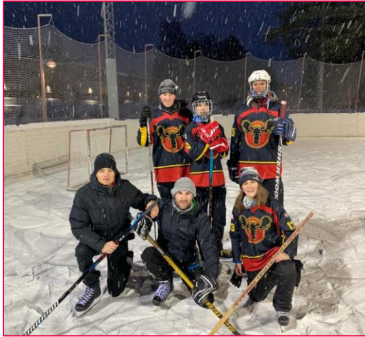
Icehockeyspiel im Freien