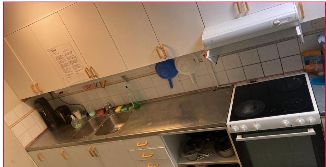
Küche im Aufenthaltsraum

Die Unterkunft bestand aus 5 Stockwerken mit jeweils ca. 20 Zimmern und einem großen Gruppenraum pro Stockwerk. Jedes Zimmer hatte ein eigenes Bad. Sollte die Küche einem zu klein sein, Freunde zu Besuch kamen oder man einfach lieber in Gesellschaft war, gibt es aber auch in jedem Gruppenraum eine große Küche und Sofas. Die Zimmer waren nicht wahnsinnig schick aber für Verhältnisse eines Studentenwohnheims dennoch sehr ordentlich und geräumig und außerdem möbliert.