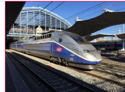
TGV in Pariser Bahnhof