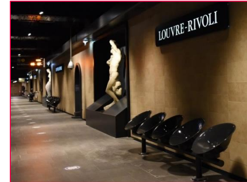
Pariser U-Bahn Station am Louvre

Neben den infrastrukturellen Vorteilen der Pariser U-Bahn, muss auf die oftmals künstlerische Gestaltung der Haltestationen hingewiesen werden. Diese Ästhetik findet sich beispielsweise im Bereich des Louvre.