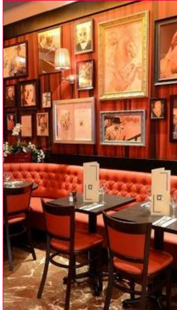
Impression aus einer französischen Brasserie im Zentrum der Stadt

Ein klassisches WG-Zimmer in der Stadt Paris wird mit 1.000 bis 1.500 € zu veranschlagen sein. Außerhalb der Stadtgrenzen mit 45minütiger Anfahrt lassen sich auch WG-Zimmer zwischen 500€ und 1.000 € finden. Eine kleine Wohnung oder ein Apartment wird in Paris jedoch kaum unter 1.200 € zu finden sein. Dennoch lohnt es sich den Flair der Stadt innerhalb der Stadtgrenzen für einige Monate genießen zu dürfen und persönlich zu wachsen.