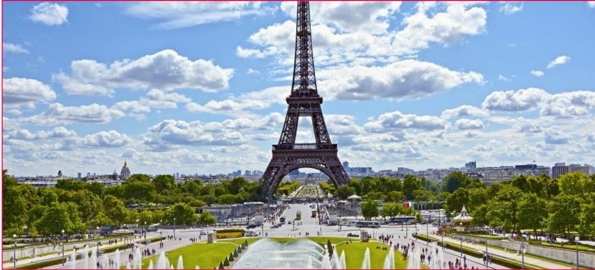
Blick auf den Eiffelturm vom Place du Trocadéro