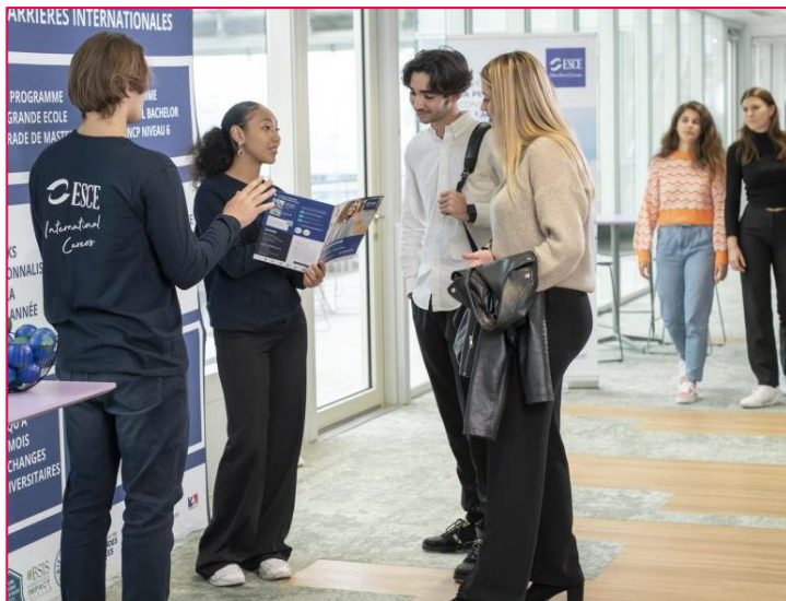
Klassenraum an der ESCE Paris

Die Lehre erfolgt in kleineren Klassen und oftmals durch zusammengesetzte Leistungen, was einen schulischen Charakter trägt. Zu belegende Fächer in Finance sind beispielsweise Mergers and Acquisitions, Sustainable Financial Strategies, Applied Portfolio Management oder International Banking and Regulation.