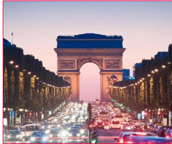
Überblick über die Stadt Paris und Arc de Triomphe

Generell muss der Aufenthalt an der ESCE sowohl als eine Weiterbildung auf akademischer als auch als eine Weiterentwicklung auf persönlicher Ebene betrachtet werden – Paris bereichert eine Person.