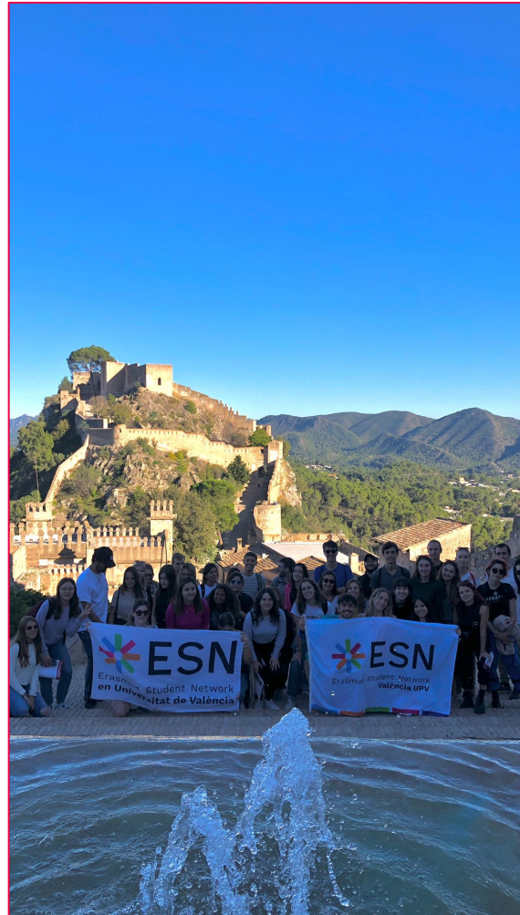
ESN Trip nach Xàtiva

Ich würde euch auch empfehlen ein paar Trips mit ESN zu machen und in ein paar WhatsApp Gruppen beizutreten. Am Anfang ist das sehr hilfreich und so lernt man auch gleich viele neue Leute kennen.