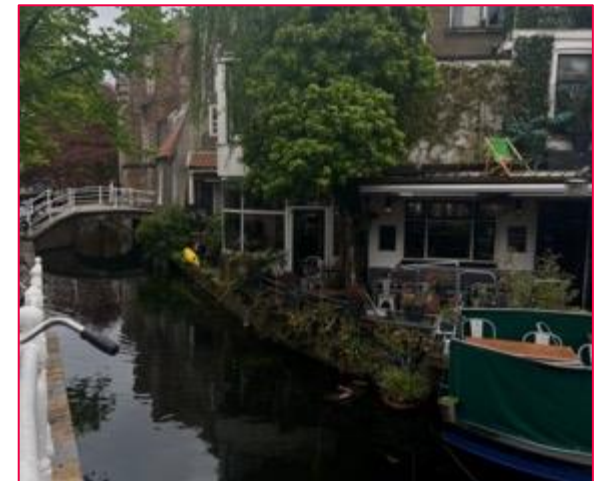
Links: Rechts oben: Sonnenuntergang am Strand Rechts unten: Delft