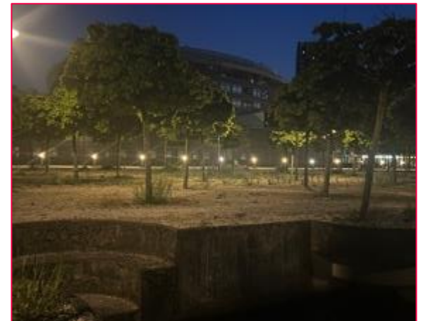
University of Applied Sciences The Hague