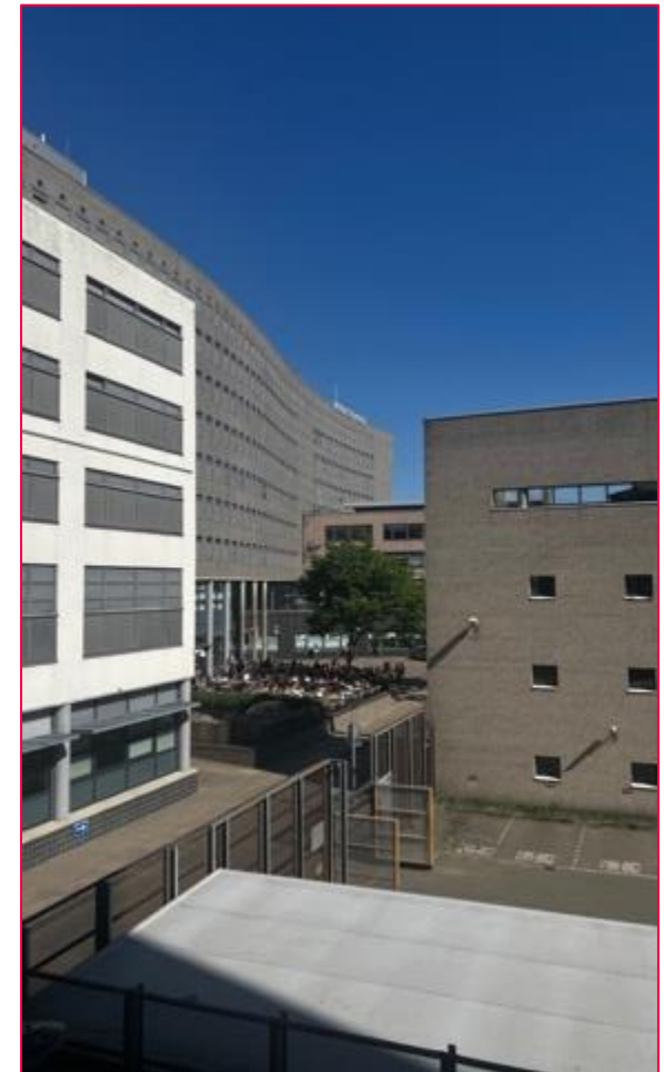
Ausblick aus meinem Fenster auf die Hochschule

Im Sinne von Mietpreisen kommt es darauf an wie und wo man wohnt aber von 400 bis 1200 € kann alles dabei sein. Lebensmittel sind in meinen Augen hier etwas teurer und auch Restaurants und Bars als in Deutschland. Wenn man jedoch in Studentenbars geht gibt es preiswerte Angebote. Die Cafeteria in der HS ist sehr gut und preiswert und auch das Café dort ist zu empfehlen. Öffentliche Verkehrsmittel sind im Vergleich günstig aber man bekommt keine Studentenkarte oder –Rabatt.