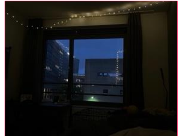
Eindrücke aus Den Haag