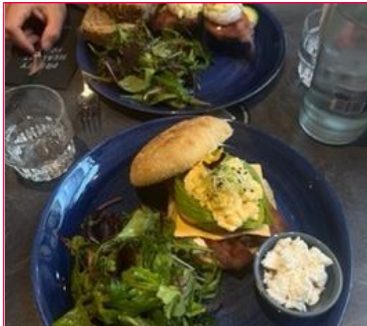
The Avocado Show Restaurant

In Den Haag und Leiden gibt es auch einige sehr schöne Museen, die sich lohnen einen Abstecher dort hinzumachen. Zum Beispiel das Kunstmuseum, das Maurishuis-Museum und das Escher Museum.