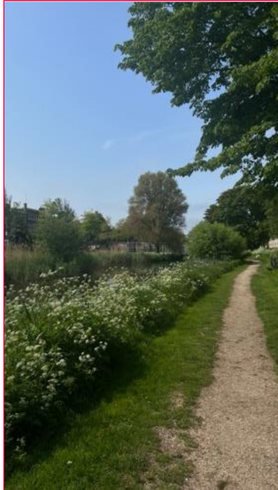
Schöner Spaziergehweg 5 min vom Campus

Ich habe in einem DUWO Studentenwohnheim gewohnt. Die Wohnsituation in Den Haag ist sehr begrenzt und deswegen sollte man sich rechtzeitig darum kümmern. Durch bestimmte Websites bietet die THUAS an, da man Exchange-Student ist, in einem University Housing zu Wohnen. Da gibt es sowohl Einzel-appartements als auch WGs. Ich habe alleine gewohnt. In der Umgebung der Uni gibt es viele verschiedene Studentenwohnheime und in welches man möchte kommt ein bisschen auf das Budget, auf die Verfügbarkeit und auch auf Glück an. Da ich meinen Hund mitgenommen hab und das persönlich mit der Uni und DUWO geklärt habe wurde mir das Single-Appartement per Direktangebot gegeben, heißt ich habe das nehmen können oder keins. Normalerweise kann man jedoch „Bieten“ also ein bisschen First-Come-First-Serve Prinzip. Mein Wohnheim war in Sichtweite von der Uni also so circa 2 min maximal zu Fuß. Ich hatte eine eigene Küche und Bad und die Wohnung hatte ungefähr 20 qm 2 .