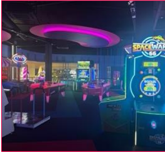
Arcade in der Mall of the Netherlands

In der Mall gibt es jeden möglichen Store und auch sehr viele leckere Essensmöglichkeiten. In Den Haag gibt es auch die sogenannte Food Hall. Dort gibt es verschiedene Arten von Streetfood und schönen Ecken wo man sich entspannen kann. Auch sonst ist Den Haag einfach schön zum schlendern weil es immer etwas neues zu entdecken gibt.