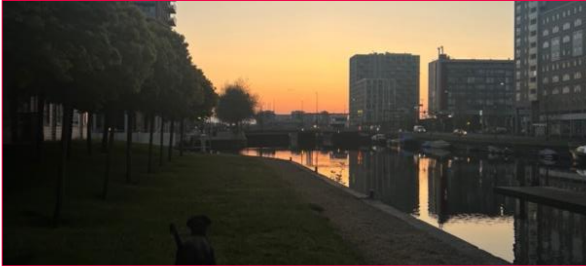
Sonnenaufgang bei der Uni