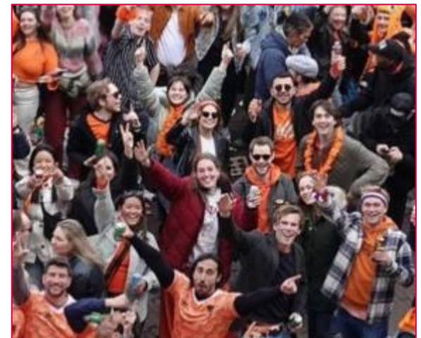
Eindrücke aus Amsterdam, Delft und Den Haag