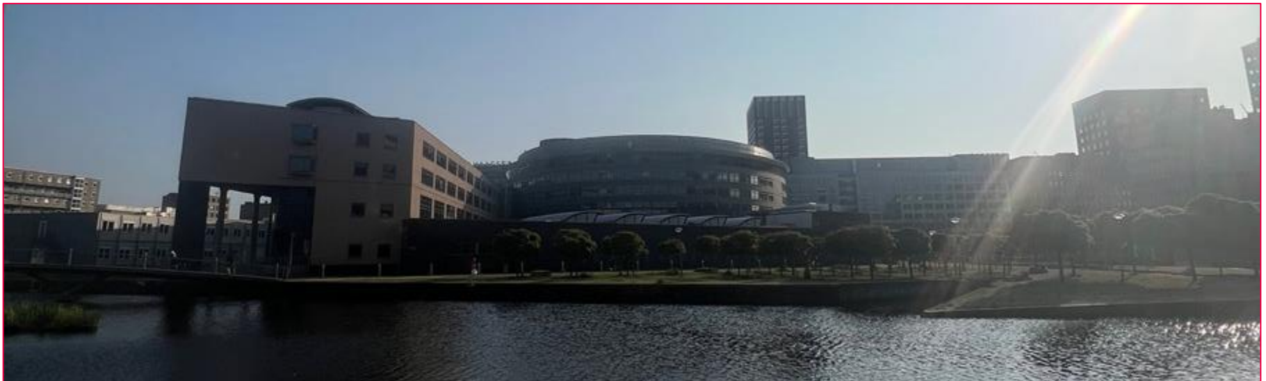
Universität von Außen

übersichtlich. Manche Prüfungen werden in der Turnhalle geschrieben, mit anderen Fächern zusammen, die dann zu dem Zeitraum zum Examhall wird. Dort gibt es zugewiesene Schließfächer für deine Sachen und zugewiesene Plätze, die du alle vorher über das Programm Osiris sehen kannst. Für die Prüfung selbst hat man immer zwei Stunden Zeit.