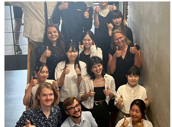
Ende des Semesters