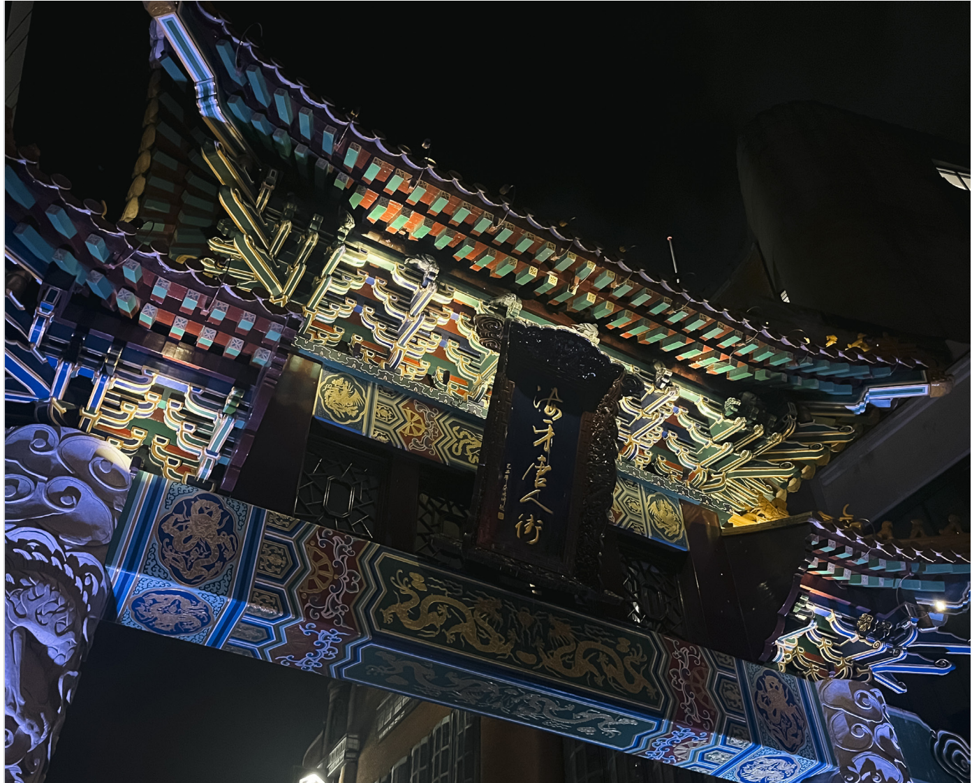
Detail einer Straße in Den Haag