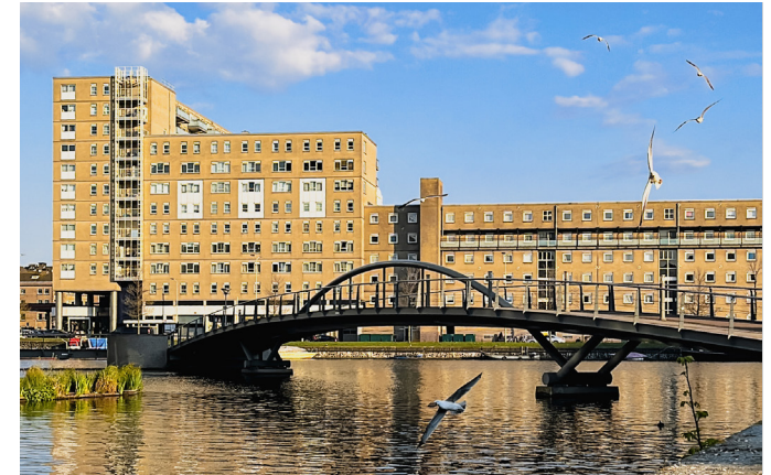
Ort in der Nähe der Universität

Das europäische Projektsemester ist bereits im Voraus strukturiert, sodass keine separate Anmeldung für die Kurse erforderlich ist. Während der Einführungswoche werden alle relevanten Informationen vermittelt, und die Plattformen, die genutzt werden sollen, werden vorgestellt. Die einzige Entscheidung, die getroffen werden ist die Auswahl eines Hauptprojekts. Dazu erstellt man nach den