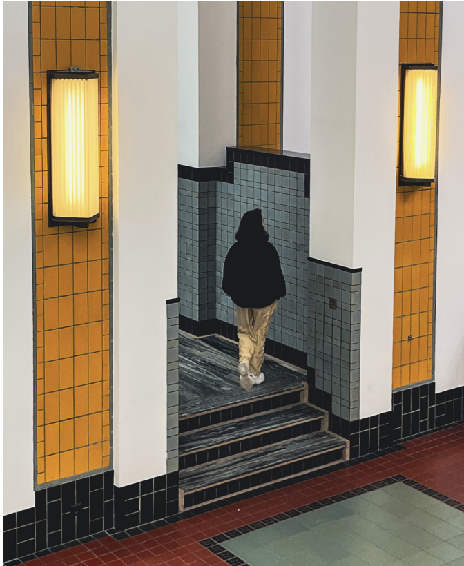
Kunstmuseum Den Haag

entscheidender Punkt ist hierbei, sich möglichst schnell um eine Unterkunft zu bewerben, sobald das System geöffnet wird, da alle verfügbaren Plätze innerhalb weniger Minuten ausgebucht sind.