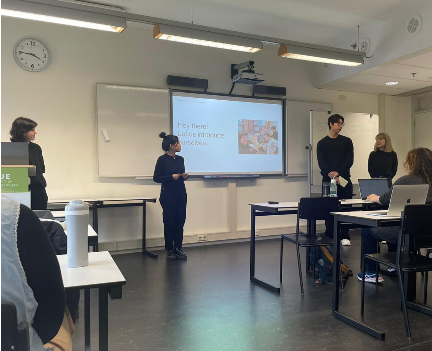
Process Bridge Zwischenpräsentation