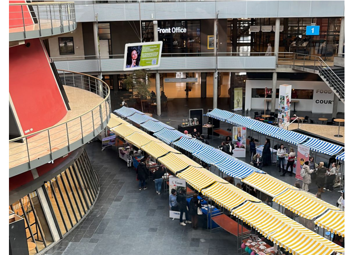
Eine Veranstaltung im Hauptgebäude