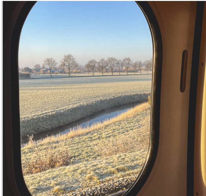
Reise nach Den Haag

Abgesehen von den Mieten, die in Den Haag wahrschein-