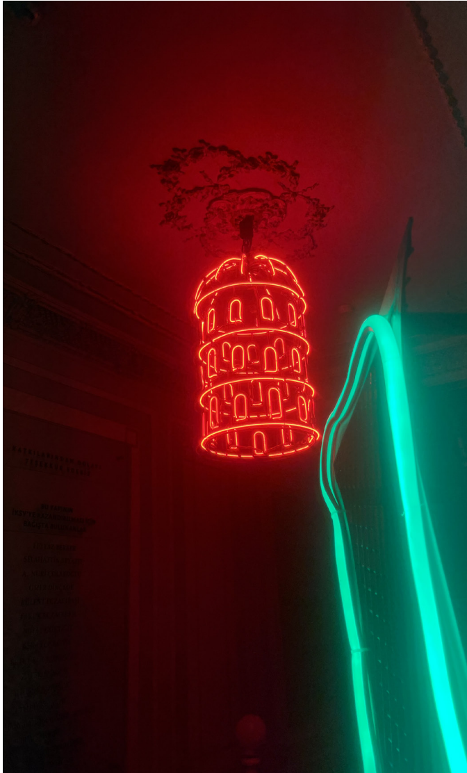
Club in der Stadt