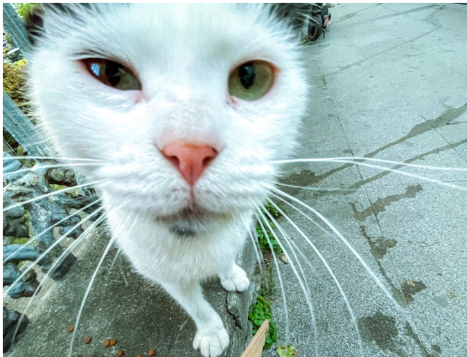
Mein Freund aus der Nachbarschaft