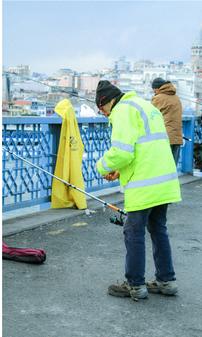
Angler auf der Galata Brücke