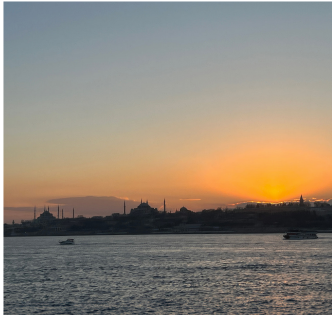
Hagia Sophia und Blaue Moschee

Der Straßenverkehr in Istanbul kann sehr chaotisch sein, insbesondere zu Stoßzeiten. Es gibt viele Autos, Busse und Taxis auf den Straßen. Einige Hauptverkehrsstraßen sind oft verstopft, was zu vielen Verspätungen führt. Wenn du pünktlich ankommen willst, nimm am besten einen Bus früher.