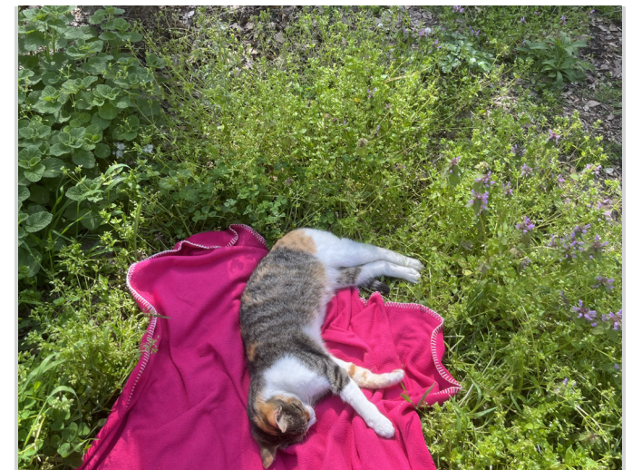
Hier gibt es viele Campus Katzen