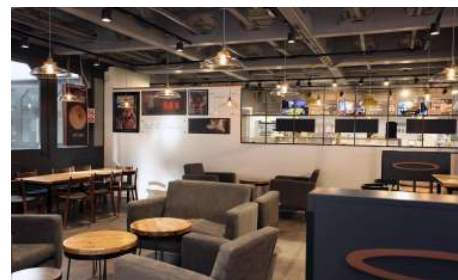
Abbildung 5: Caffee im Business Gebäude