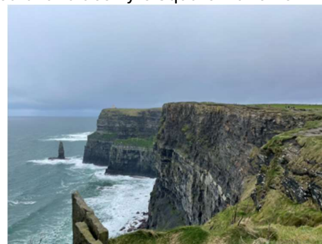
Abbildung 9: Cliffs of Moer

Galway liegt etwas weiter entfernt, ist aber eine Zug- oder Busreise wert. Man kann durch die verwinkelten Gassen der Altstadt laufen und den Straßenmusikern zuhören. Ein absolutes Muss ist der Besuch der Galway Cathedral und des Eyre Square. Für eine authentische irische Erfahrung sollte man einen Abend in einem der vielen Pubs mit Live-Musik genießen. Außerdem kann man von Galway aus an die Cliffs of Moer fahren, welche eine der