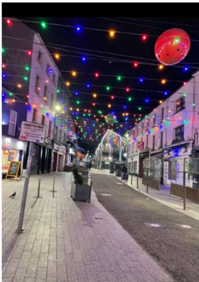
Abbildung 1: Waterford Innenstadt

Wohnheim eine 24-Stunden besetzte Rezeption, einen Gemeinschaftsraum mit großem Fernseher und Billardtisch sowie einen Wäscheservice. Die Lage des WIT City Campus ist ideal, mit nur etwa 10 Minuten Fußweg ins Stadtzentrum. Der nächstgelegene Supermarkt, ein gut sortierter Lidl, ist ebenfalls nur 10 Minuten entfernt. Für weitere Einkaufsmöglichkeiten gibt es in der Nähe noch einen Aldi und einen Tesco. In letzterem findet man alles von Einrichtungsgegenständen über Lebensmittel bis hin zu Kleidung findet. Wichtig zu beachten ist, dass man sich frühzeitig für eine Unterkunft anmelden sollte, da diese schnell ausgebucht sind. Ich selbst habe mich etwa ein Jahr vor Beginn meines Auslandssemesters für ein Zimmer beworben.