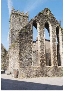
Abbildung 4: Bishops palace

Als älteste Stadt Irlands ist Waterford reich an historischen Sehenswürdigkeiten. Ein besonderes Highlight ist das House of Waterford Crystal, wo Besucher die faszinierende Kunst der Kristallherstellung erleben und glänzende Exponate bestaunen können. Der Viking Triangle, das