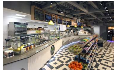
Abbildung 6: Centra

Die SETU verfügt zudem über eine gute Mensa namens Centra im Business-Gebäude. Nebenan gibt es ein schönes Café, in dem ihr euch mit Freunden zwischen den Vorlesungen treffen könnt.