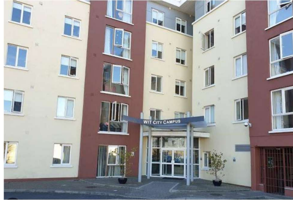
Abbildung 2: Eingang City Campus Unterkunft

In Waterford stehen Studierenden drei Unterkunftsmöglichkeiten zur Verfügung. Zum einen gibt es den WIT City Campus und den WIT College Campus, beides universitätseigene Studentenwohnheime. Zum anderen steht das private Studentenwohnheim Riverwalk zur Auswahl. Meine persönliche Erfahrung im WIT City Campus, in einer Wohngemeinschaft mit fünf Personen, war durchweg positiv. Jedes Zimmer verfügt über ein eigenes Badezimmer, und der gemeinsame Wohnbereich ist großzügig gestaltet, inklusive einer voll ausgestatteten Küche, einem Esstisch, bequemen Couches und einem kleinen Fernseher. Zusätzlich bietet dieses