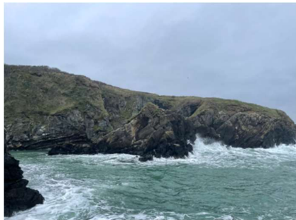
Abbildung 7: Cliff walk

Tramore ist nur eine kurze Fahrt von Waterford entfernt. Die Anreise gestaltet sich denkbar einfach: Man kann entweder einen lokalen Bus nehmen oder mit dem Auto entlang der Küstenstraße fahren. In Tramore erwartet wird man von einem langen Sandstrand erwartet, der zum Entspannen und Baden einlädt. Der Tramore Amusement Park und die Meereswelt Oceanic Manors sind einen Besuch wert. Für Naturliebhaber empfiehlt sich eine Wanderung entlang der Klippenpfade.