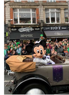
Abbildung 10: Saint Patrick's Parade

Dublin, die Hauptstadt Irlands, ist leicht von Waterford aus mit dem Zug oder Bus erreichbar. In Dublin kann man das Kilmainham Gaol besuchen, das Book of Kells in der Trinity College Library bewundern und entlang des Flusses Liffey spazieren. Literaturliebhaber sollten unbedingt das James Joyce Centre besuchen. Und natürlich darf ein Pint Guinness im berühmten Temple Bar District nicht fehlen. Wenn man zur richtigen Zeit in Dublin ist, man auch die berühmte Saint Patrick's Parade anschauen.