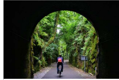
Abbildung 3: Greenway

Im Laufe des Semesters ist es sehr ratsam, bei Problemen auf eure Professoren zuzugehen. Ich habe persönlich nur positive Erfahrungen damit gemacht. Zum Beispiel war in einem meiner Kurse der Stoff sehr interessant, aber ich hatte Schwierigkeiten, die Professorin aufgrund ihres Akzents und ihres Sprechtempos zu verstehen. Als ich sie darauf ansprach, reagierte sie sehr verständnisvoll und bot mir an, nach der Vorlesung kurz über die Dinge zu sprechen, die ich nicht verstanden hatte. Das hat dann wirklich gut funktioniert.