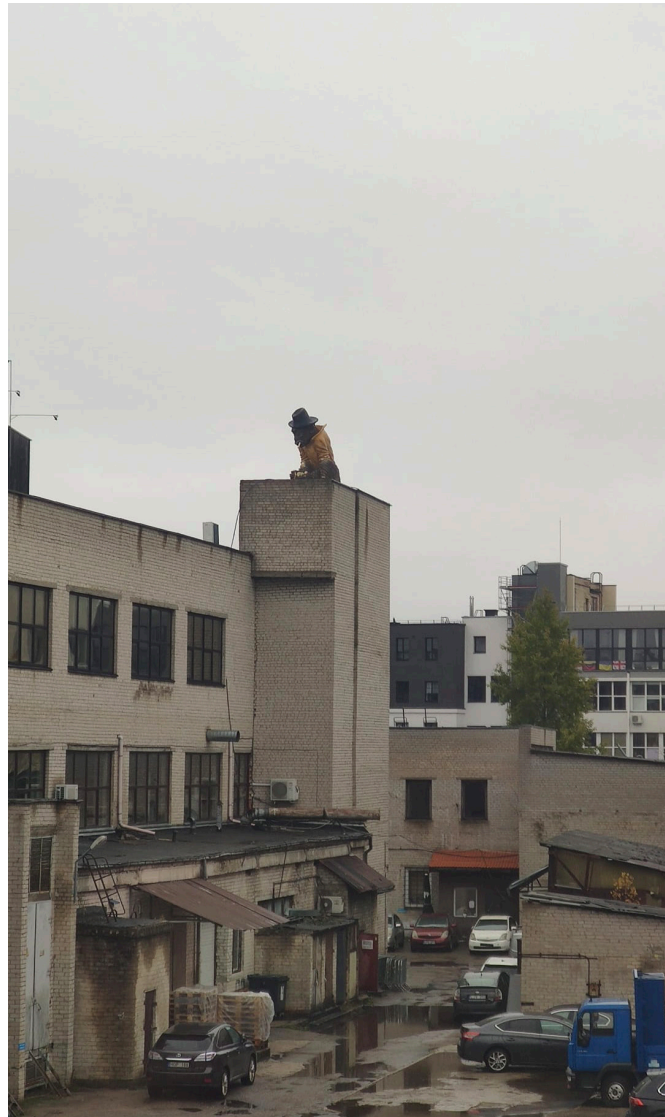
Blick auf dem Zeichensaal