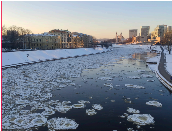
Neris bei -28 Grad