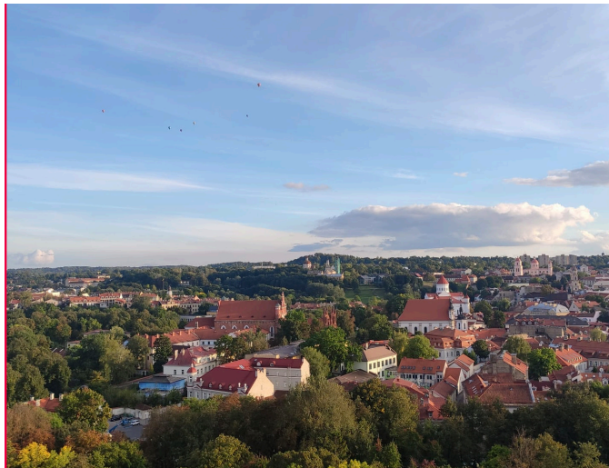
Blick auf Vilnius von Gediminas Tower