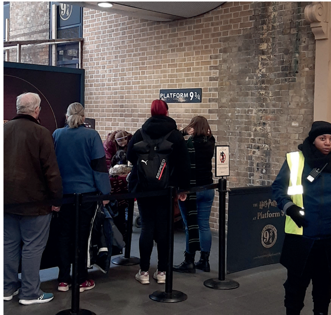
Harry Potter Gleis, Bahnhof St. Pancras