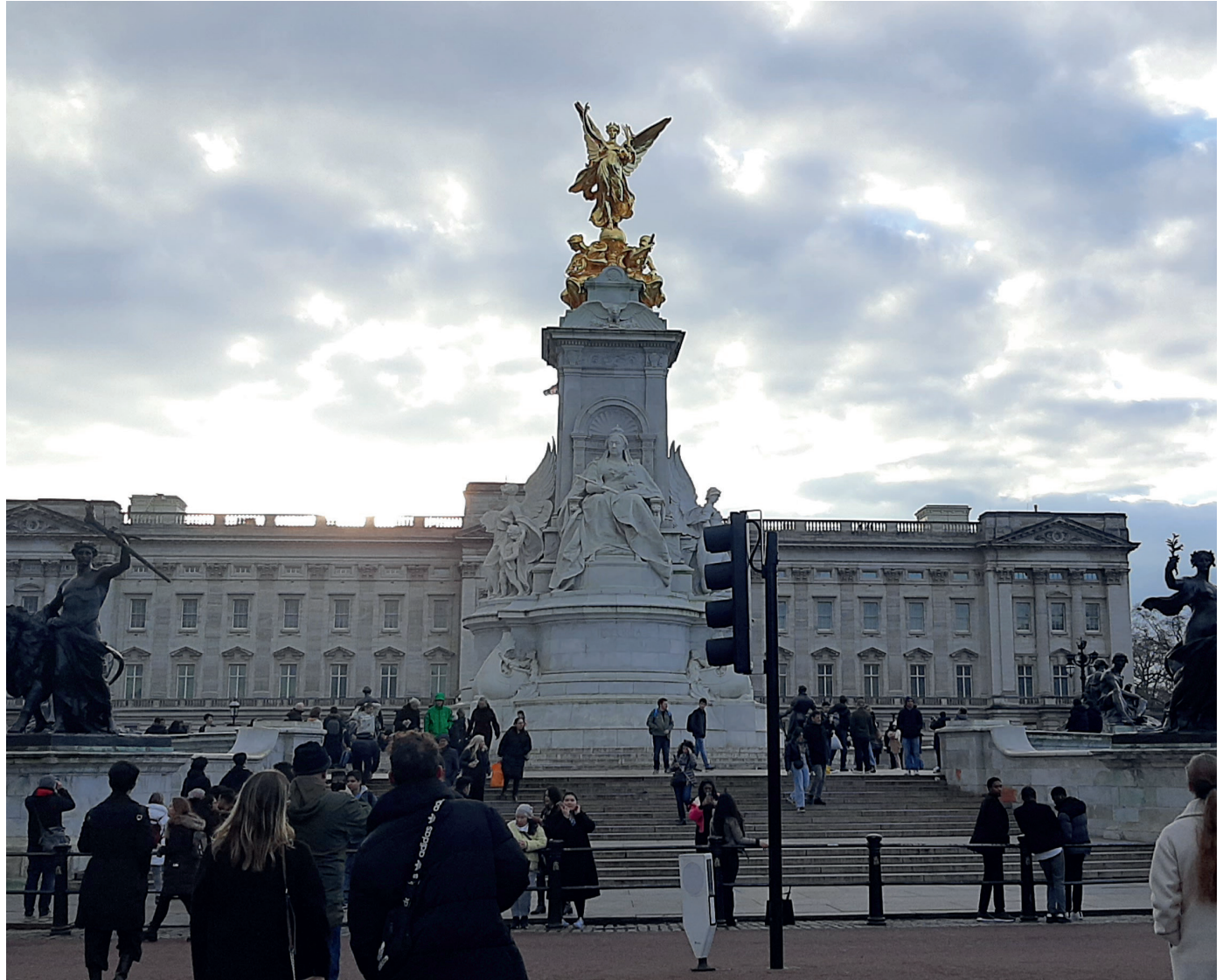
Buckingham Palace am Mittag