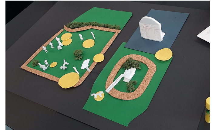
Exkurs Aufgabe aus dem Studium

An dieser Stelle möchte ich für zukünftige Austauschstudenten vom Studiengang „User Experience Design“ am