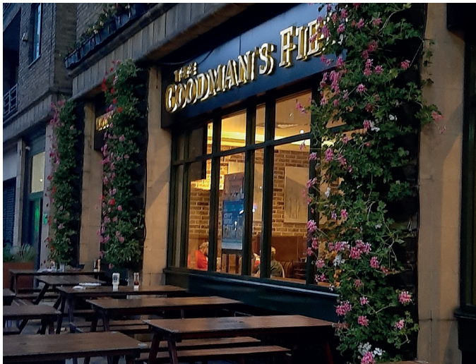
Pub in Londoner Innenstadt