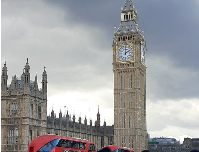
Big Ben und London Busse