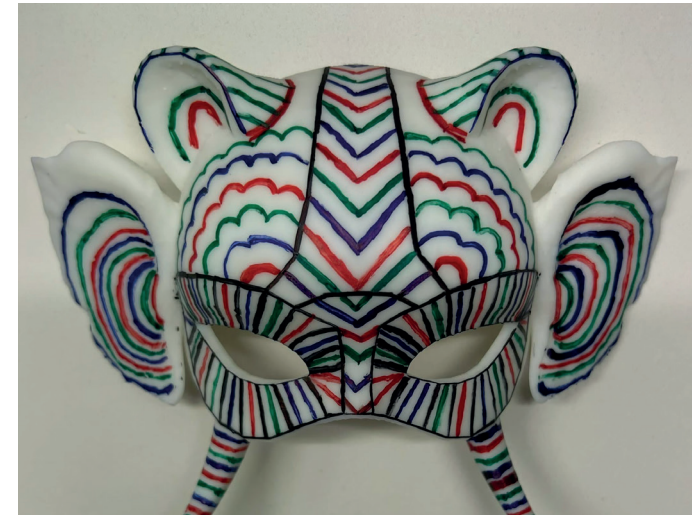
Animal Mask meiner Uni Gruppe