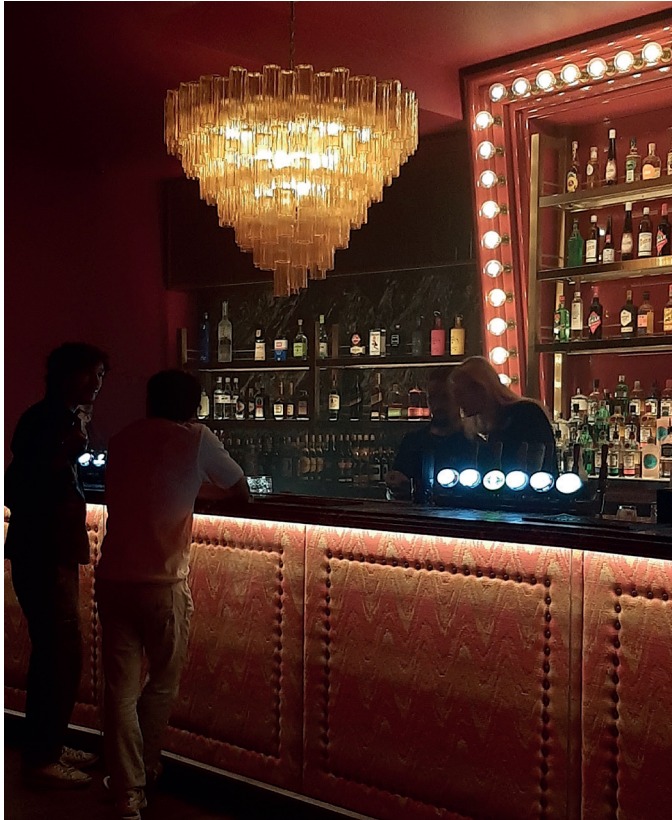
Bar Theke im KOKO Club