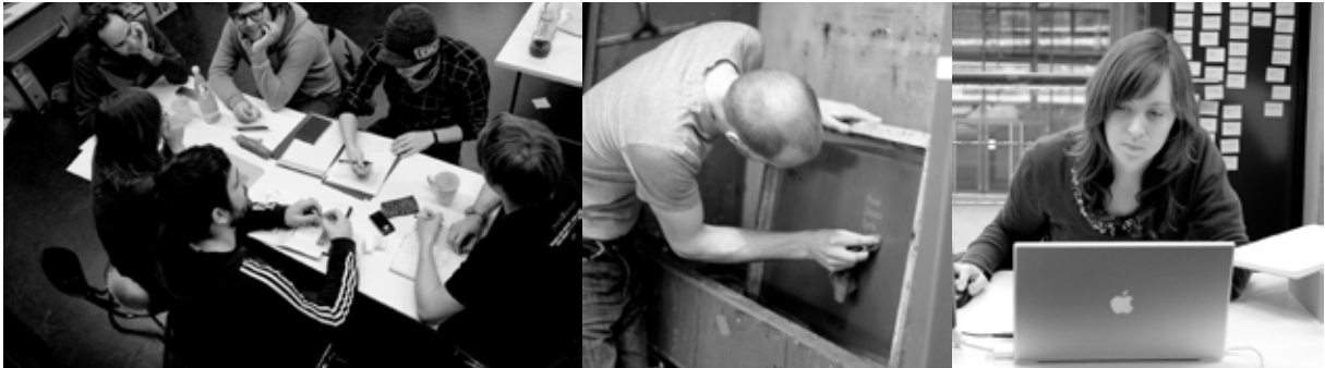
Das Arbeiten in Teams ist nicht nur typisch für die Medienstudiengänge. Konzeptionelles Arbeiten und methodische Überlegungen nehmen einen immer höheren Stellenwert im Studium ein. Dies entspricht dem Wandel des Designers vom Grafiker zum Kommunikationsexperten.