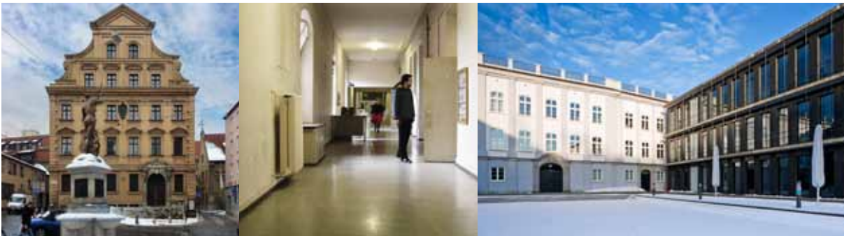
In der Stadtmetzg befand sich die Reichsstädtische Kunstakademie (links), viele Studierende kennen noch die langen Gänge des alten Hauptkrankenhauses, in dem der Fachbereich Gestaltung vor dem letzten Umzug untergebracht war. (Mitte) Seit 2006 befindet sich die Fakultät in ihrem neuen Gebäude am Roten Tor.

Aus Augsburg, Lehre in Augsburg bei Johann Georg Bergmüller, mit 19 Jahren Meisterrecht und Heirat in Augsburg. Malte 1783 auf eigene Kosten