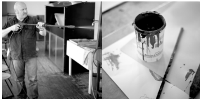
Kreativität kann sich auch in Zeiten von Digitalisierung und Virtualisierung nicht in klinisch sauberen Reinräumen entfalten – Design braucht Zeit und Platz.

welch große Bedeutung ein erfolgreicher Auftritt in der Öffentlichkeit für die Schule, ihren Direktor und die Studenten hat. Als Werkkunstschule gehörte die Augsburger Schule nun zu einem bestimmten Schultyp; Studiendauer waren acht Semester, davon vier als Grundlagenstudium, darauf folgend das Entwurfstudium mit Aufgaben aus der Praxis. Das Ziel dieses Studiums war ein berufsbefähigender Abschluss. Handwerkliches Können mit der Selbsteinschätzung des Gestalters als Praktiker sollte das Ergebnis sein, des Gestalters als Handwerker. Die Forderungen an den Schulträger hinsichtlich der Räume, des Lehrpersonals waren besser zu vertreten als zuvor durch die Kunstschule. Gewiss war die Augsburger Schule erst „aufgestiegen“ zum Kreis der Werkkunstschulen, ein außerhalb Bayerns längst akzeptierter Schultyp. Neu in Augsburg war, dass nun Zeugnisse Verlauf und Abschluss der Ausbildung begleiteten. Jeder Student in der Zeit von 1960 bis 1972 musste, solange die Werkkunstschule bestand, zudem ein selbst produziertes Dokument der Arbeiten, die