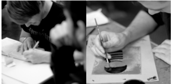
Händisches Arbeiten ist auch im Zeitalter digitaler Werkzeuge eine Voraussetzung mediengerechten Materialverstehens und anschaulicher Visualisierung. Pinsel und Zeichenstift gehören zur Grundausrüstung jedes Studierenden.

konnte Nerdinger sich stützen, als es um Ausbau und Weiterentwicklung der Kunstschule ging. Für diese 1946 wieder gegründete Kunstschule der Stadt Augsburg war die Aufnahmeprüfung die einzige Leistungskontrolle. Weder die Dauer des Studiums noch die Lehrpläne waren eindeutig festgelegt. Es gab jedoch allgemein gehaltene