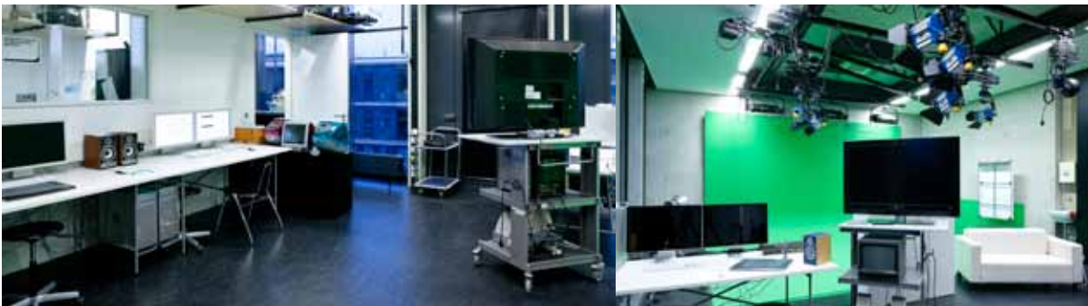
Mit der Umstellung auf die Abschlüsse Bachelor und Master wurde der Studiengang Multimedia nach gut 10jährigem Bestehen in Interaktive Medien umbenannt. Inzwischen sind die digitalen Werkzeuge auch die Grundlage des Studienganges Kommunikationsdesigns.

Die Studiengänge werden im Rahmen der Bologna-reform auf die neuen Studienabschlüsse Bachelor of Arts (7 Semester einschließlich Praxissemester) und Master of Arts (drei Semester) umgestellt.