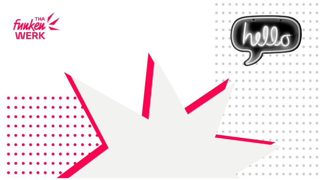
Funkenwerk-Stern.png (210,0 KB)