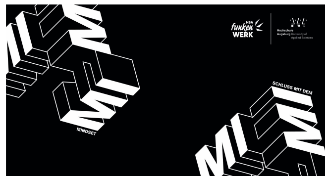
Funkenwerk-Werkschau-2020-V2.jpg (1,9 MB)