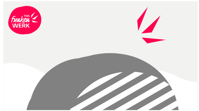
Funkenwerk-Funke.png (81,6 KB)