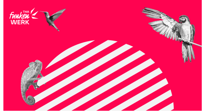
Funkenwerk-Natur.png (491,2 KB)