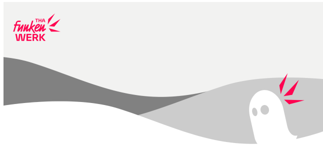
Funkenwerk-Wellen.png (51,6 KB)